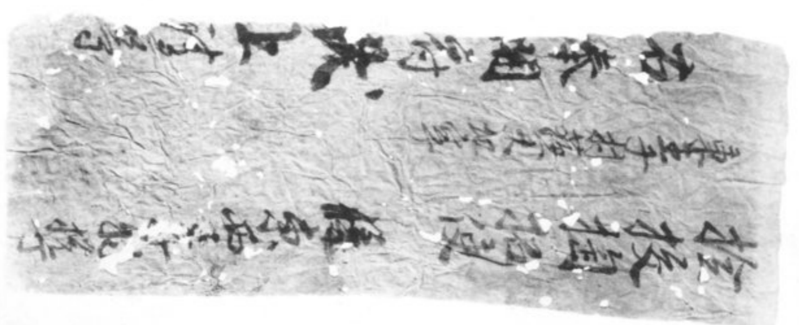
(16) (1) 檢校拘使牒狀(庫車) (2) 唐開元貳拾捌載文書斷片(吐峪溝) (3) 唐戶籍斷片(吐峪溝) (4) 唐地券斷片(吐峪溝)