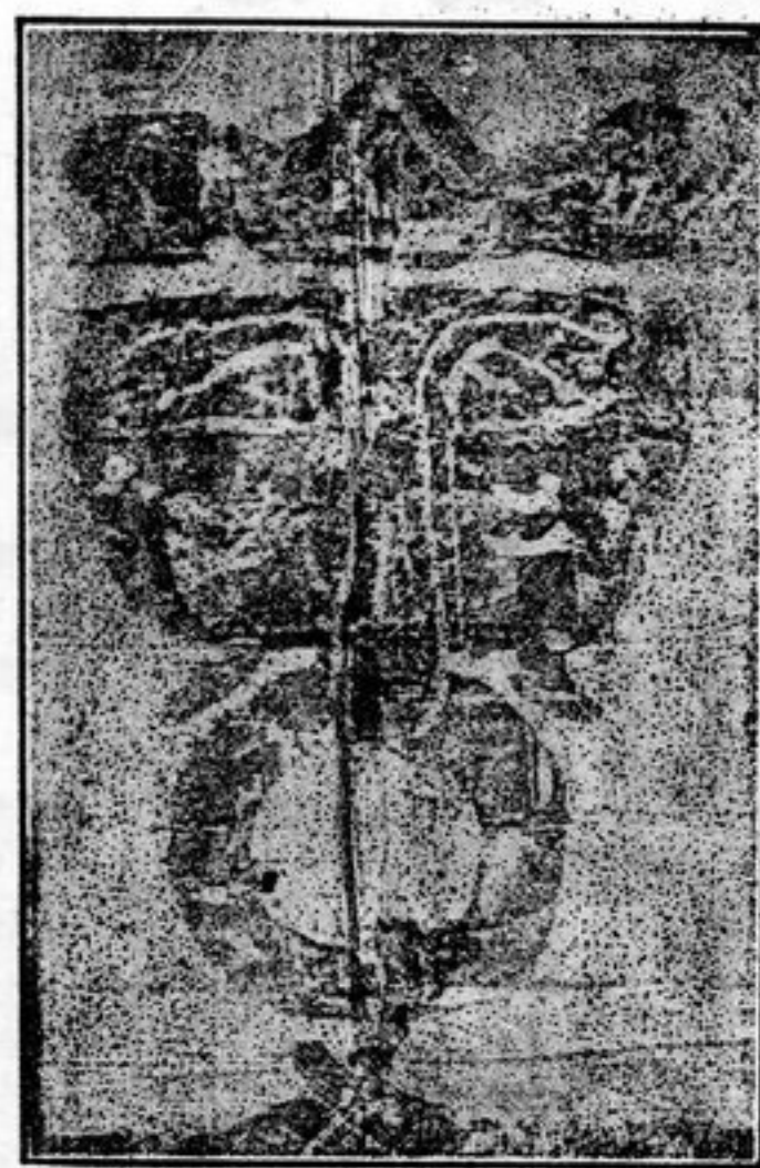
圖三二第插 像畫聚陽射漢