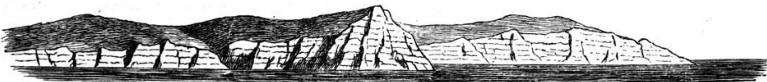
Fig. 6. Ansicht von Cape Collinson .