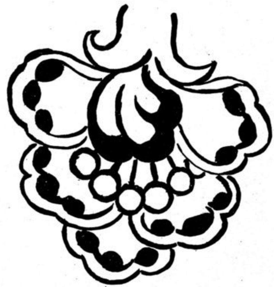
Fig. 2 Größe \frac{1}{4}

Ornamente der herabgestürzten Decke des Ganges um das Freskenzimmer von \alpha