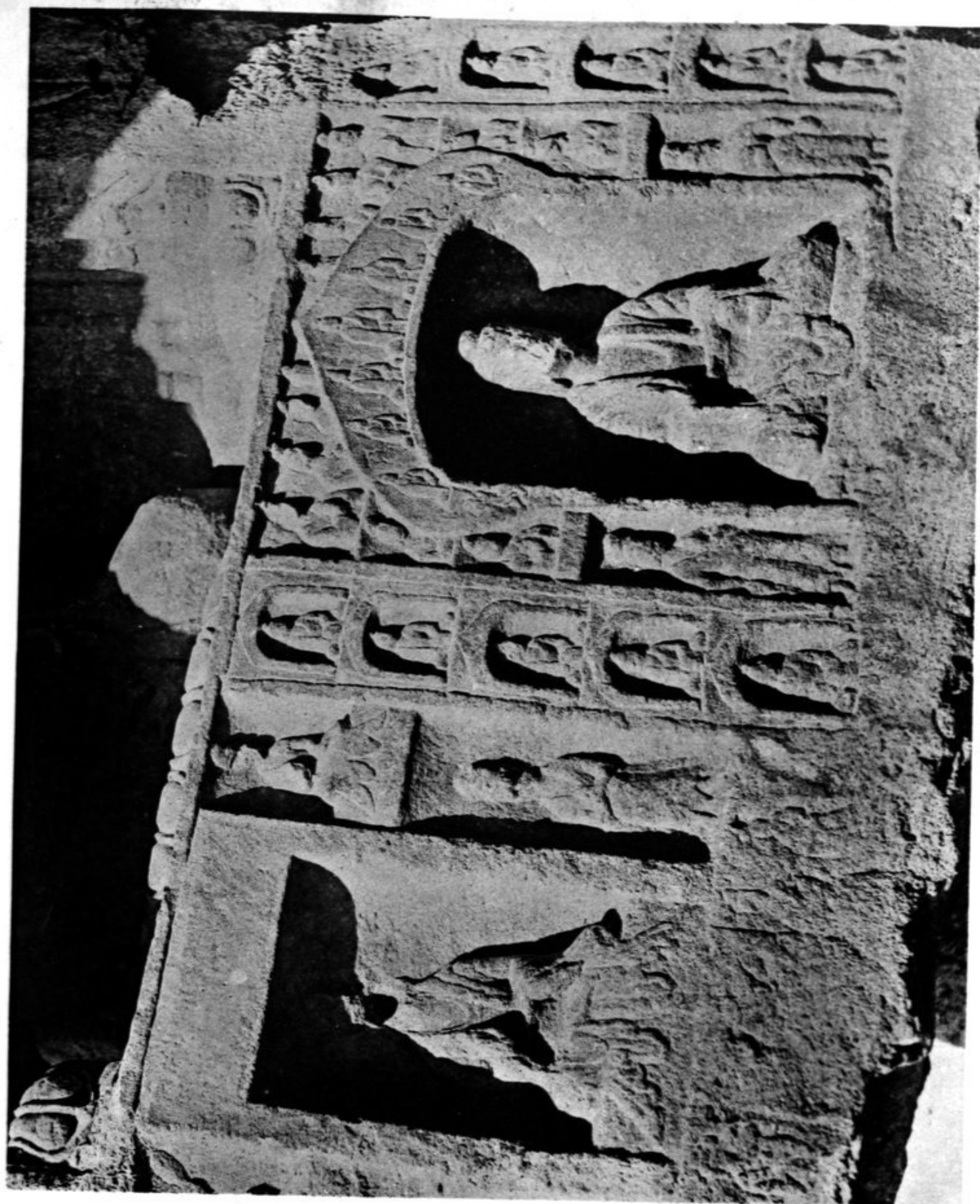
N° 240 YUN-KANG Avant-dernière des grottes situées à l'Est du Temple Face occidentale de l'embrasure