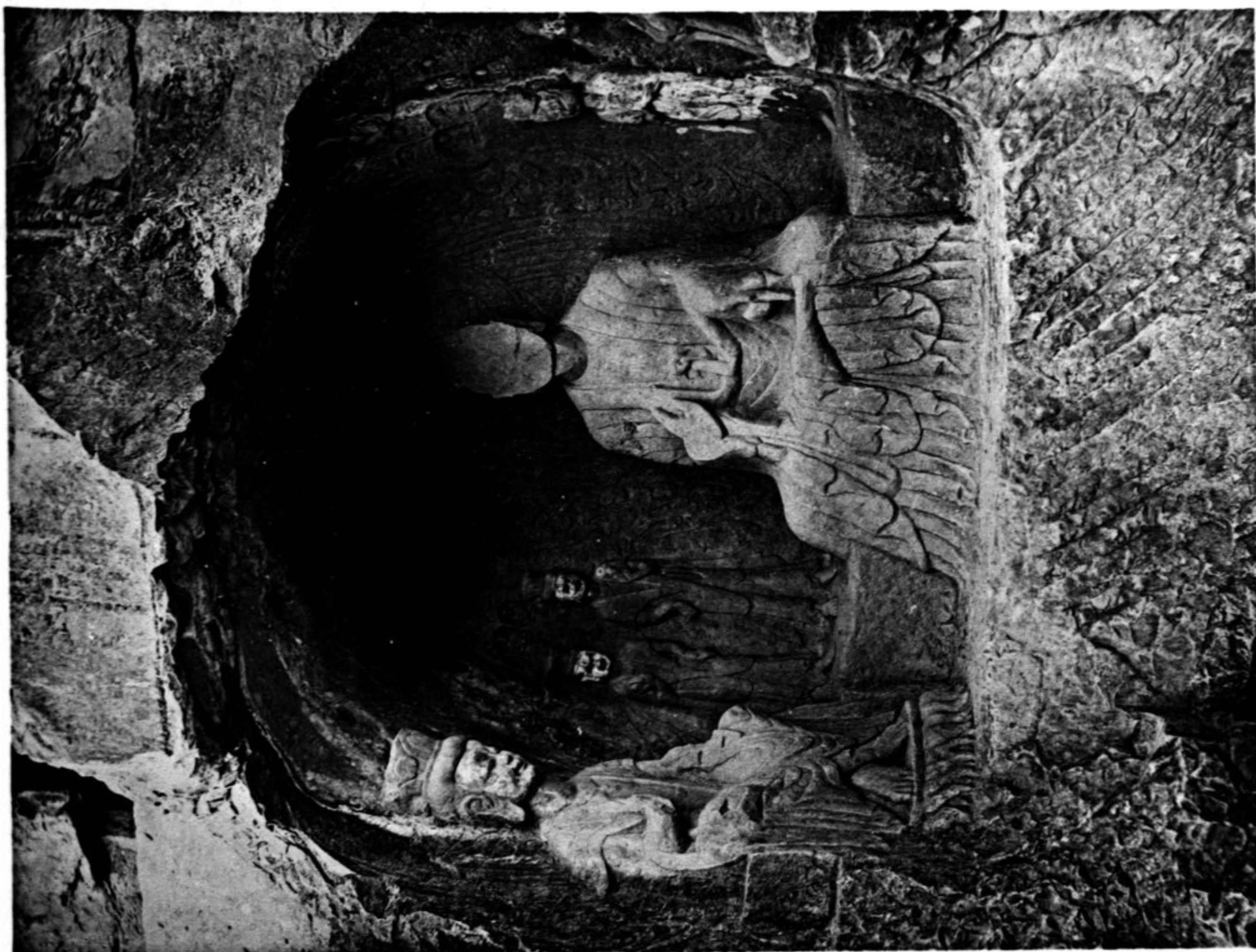
N° 311 LONG-MEN Niche au bord de la route Au-dessous et à gauche du n° 310