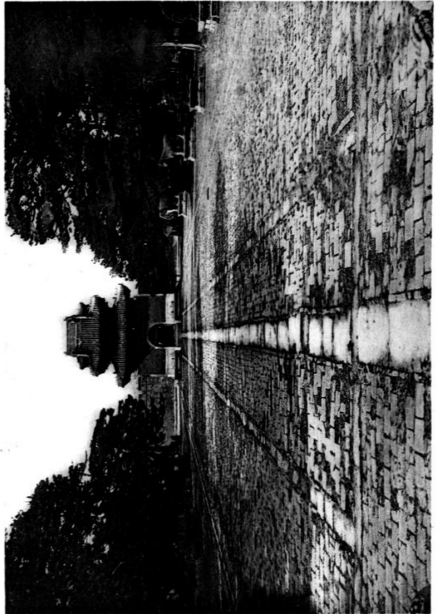
N° 781 Tchao ling Sépulture de l'empereur Tai tsong (1627-1643) au nord de Moukden Pavillon de la stèle et allée des animaux