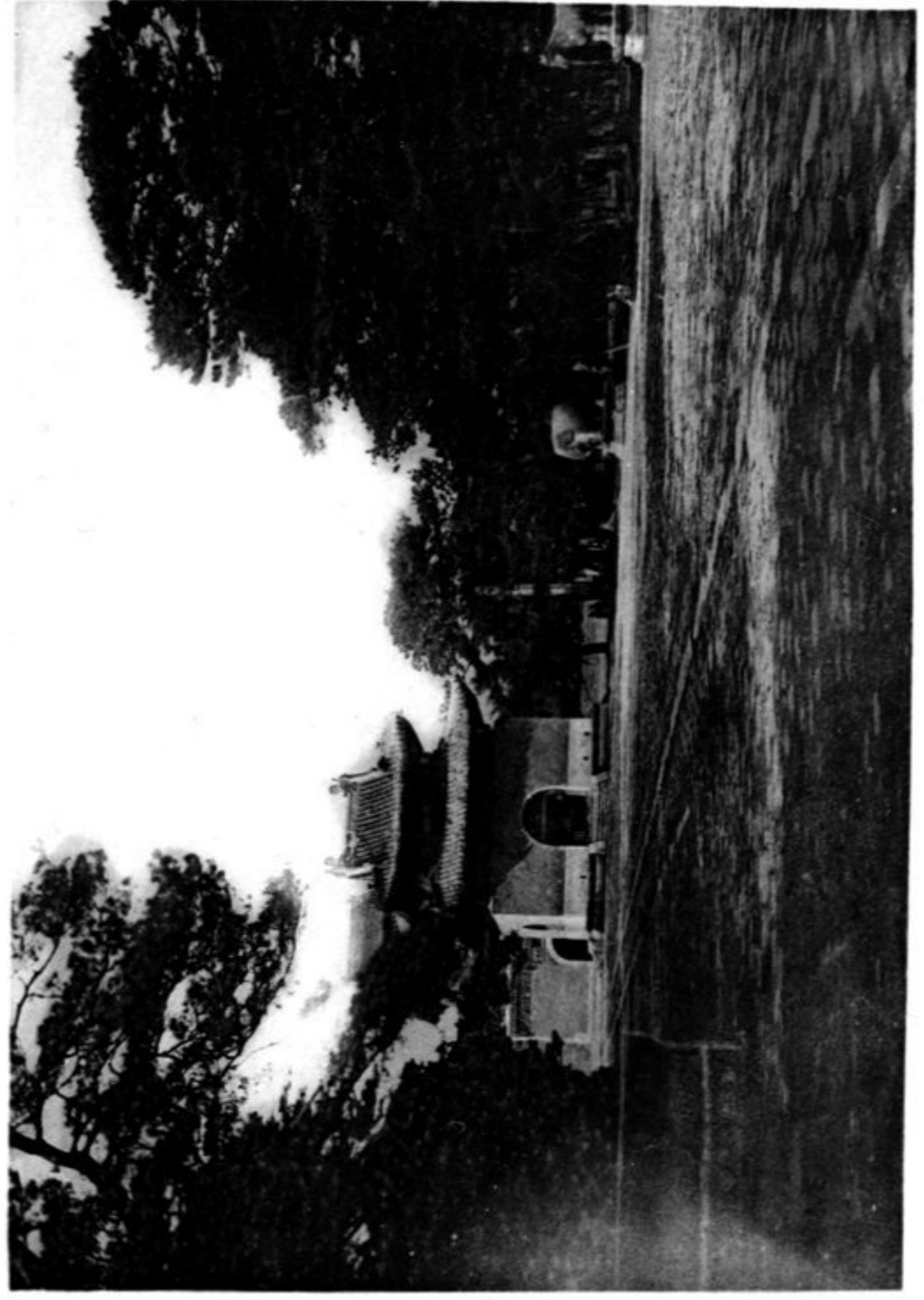
N° 782 Tchao ling Sépulture de l'empereur Tai tsong (1627-1643) au nord de Moukden Pavillon de la stèle et allée des animaux