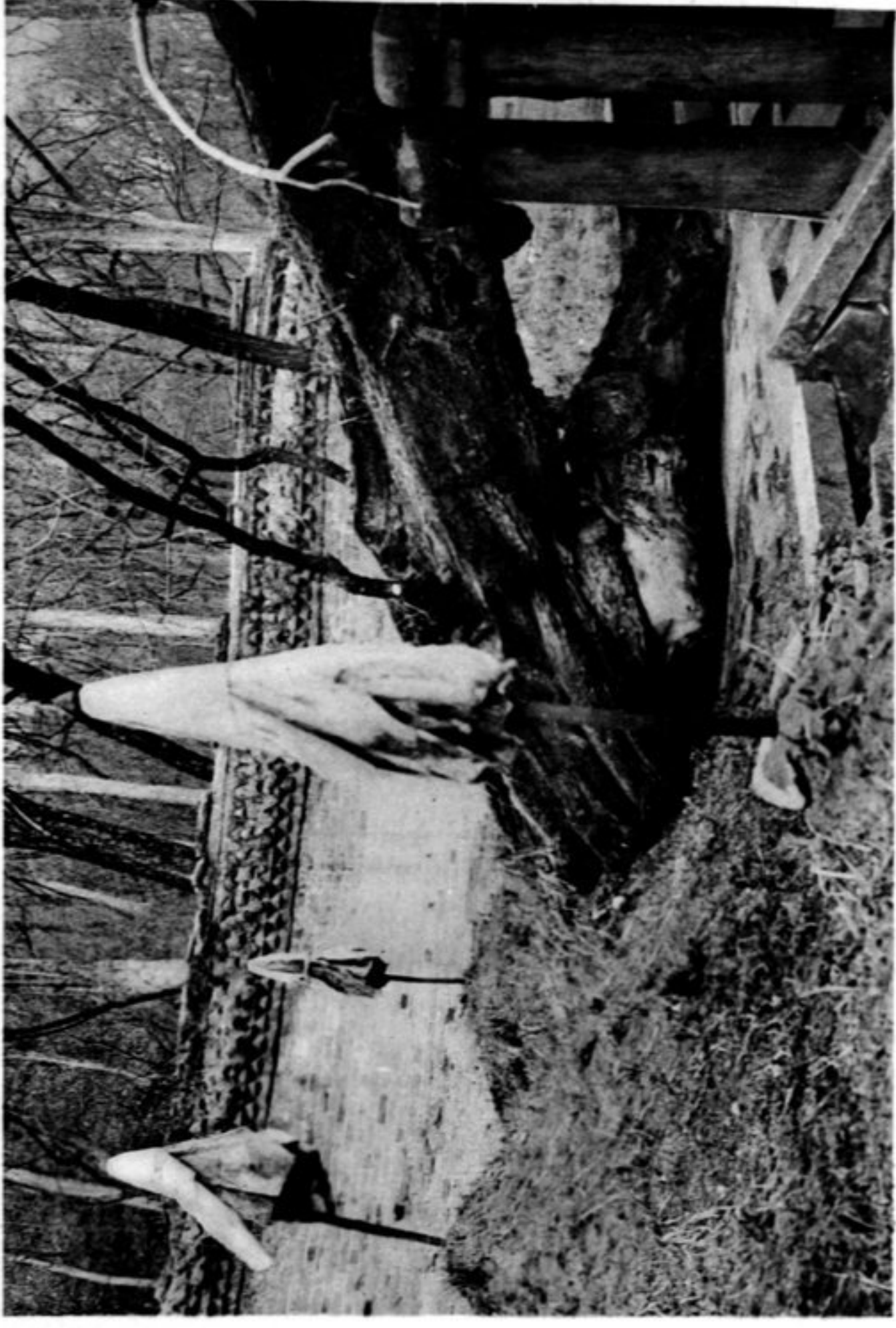
N° 792 Yong ling Les Tombes et l'arbre sacré