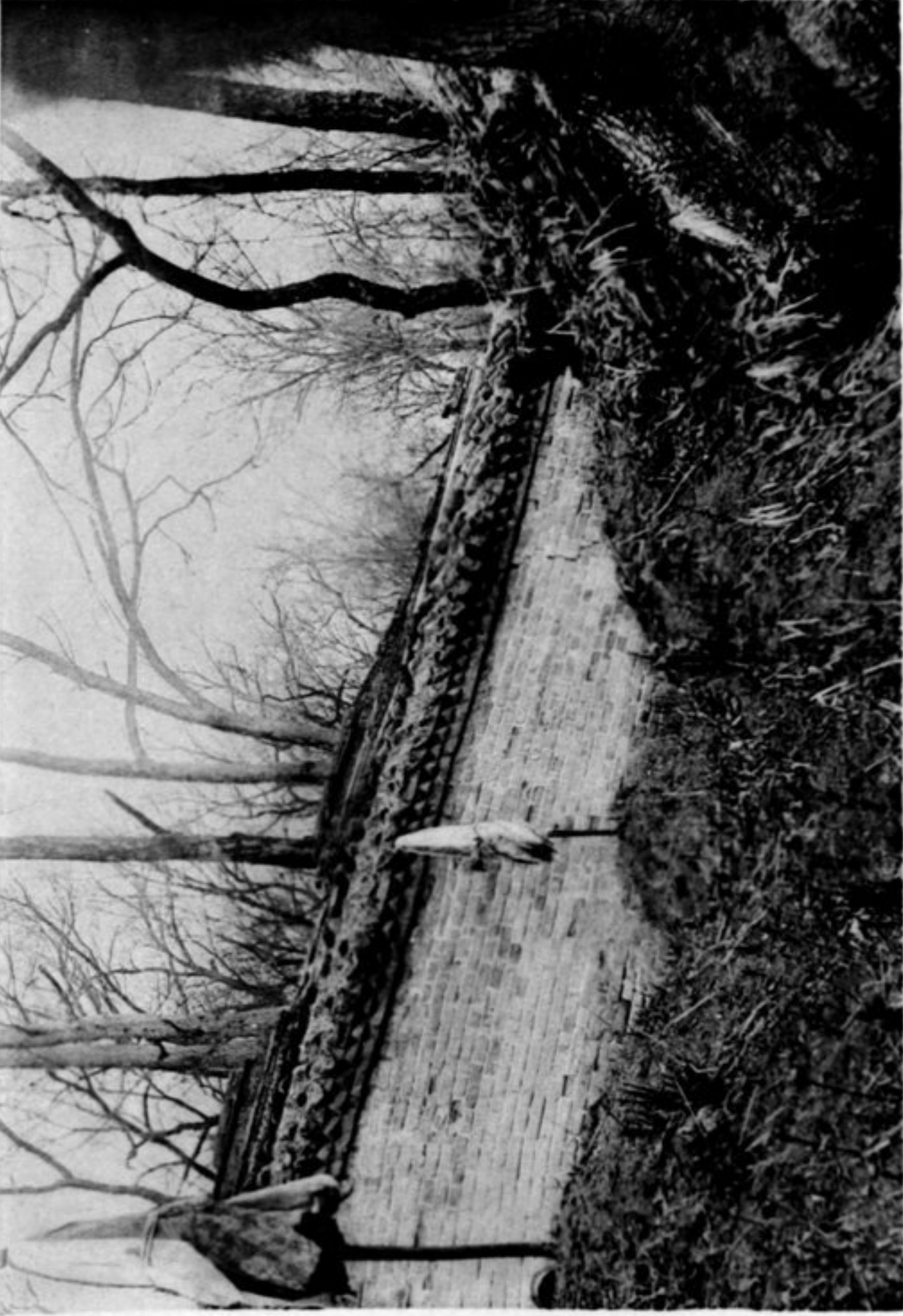
N° 791 Yong ling Les Tombes