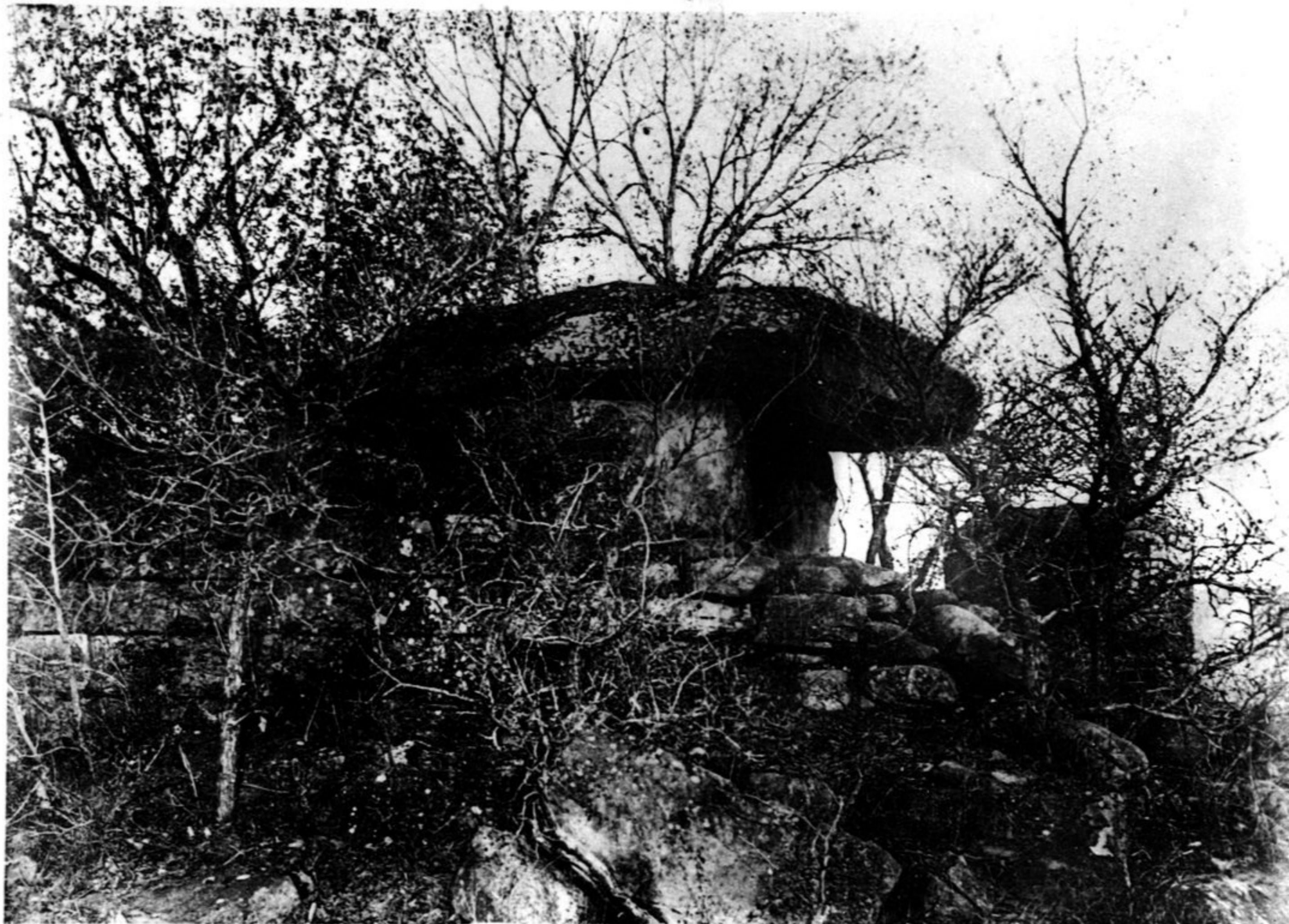
N° 804 Chambre de la pyramide à demi-ruinée qui se trouve à l'Est de la Tombe du Maréchal