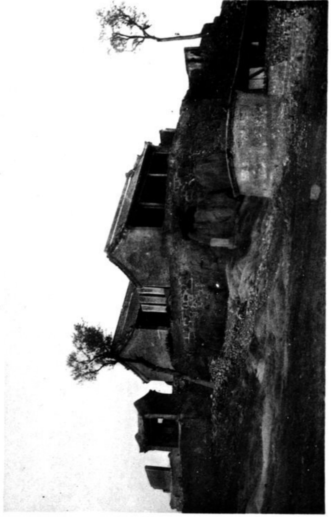
N° 816 Temple de la Mong kiang niu à Chan hai kouan