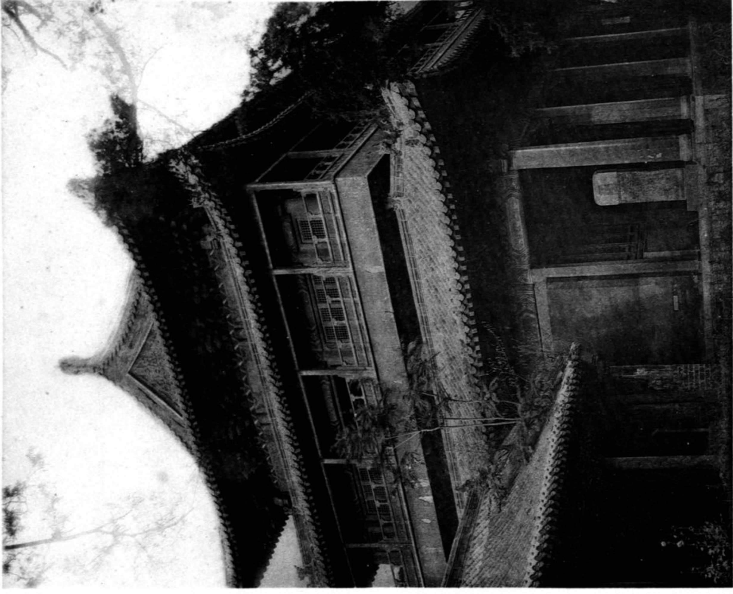
N° 850 Temple de Confucius Angle Sud-Ouest du K'ouei-wen ko