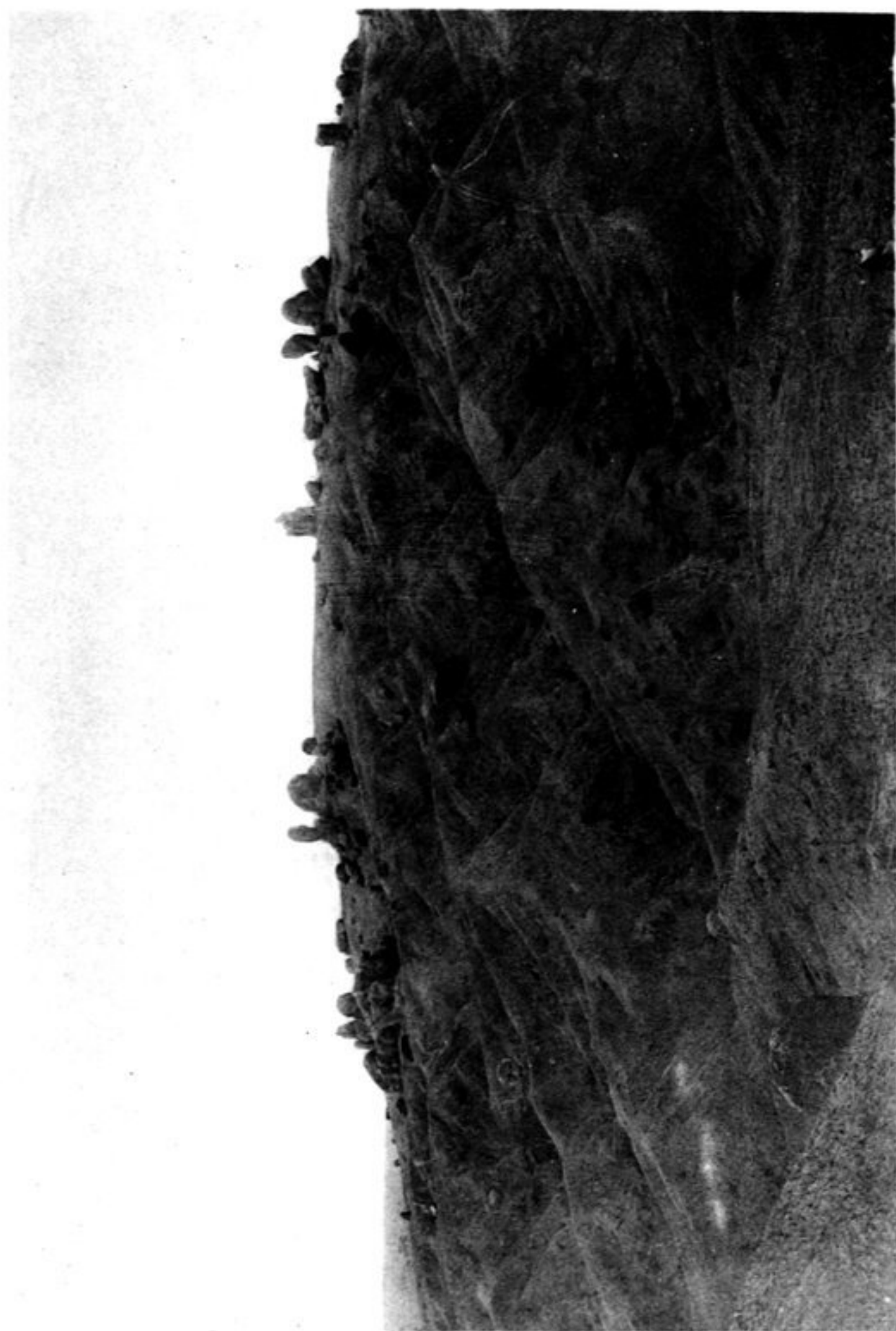
N° 896 Roches au nord de Tscou hien