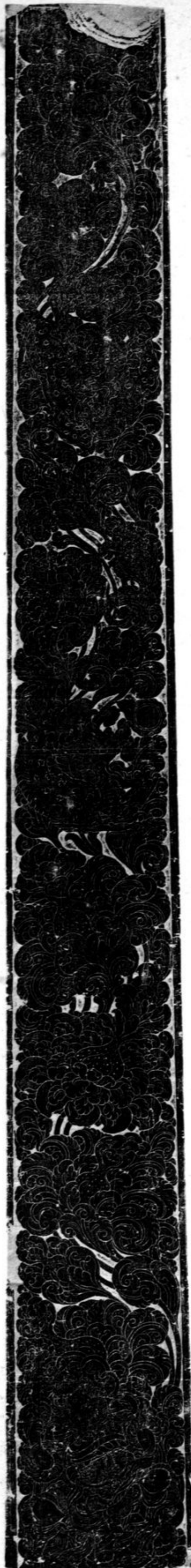
N° 967 Bordure d'une stèle de l'année 822 p. C.