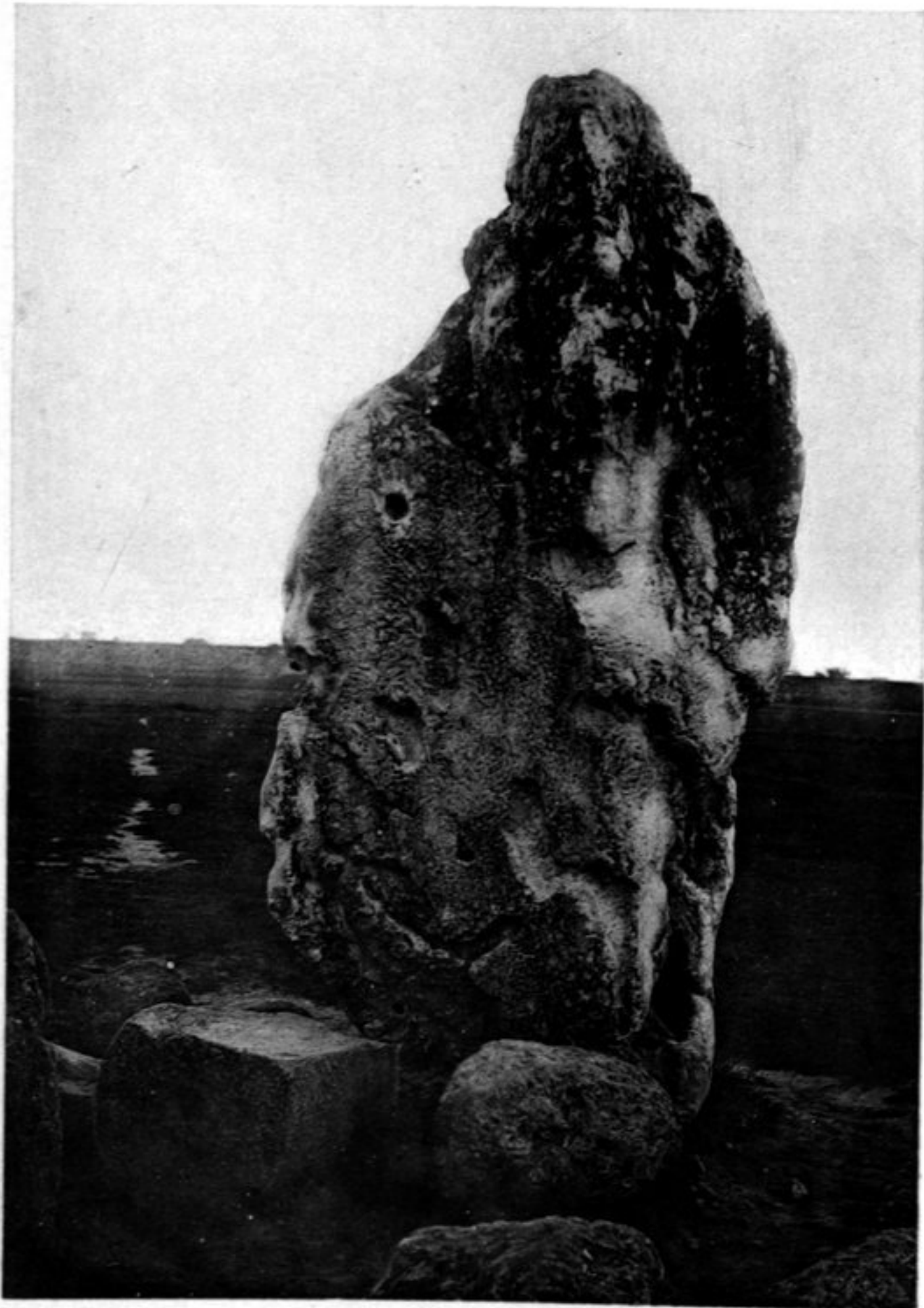
N° 1014 Si-ngan fou Pierre portant l'empreinte d'une main humaine