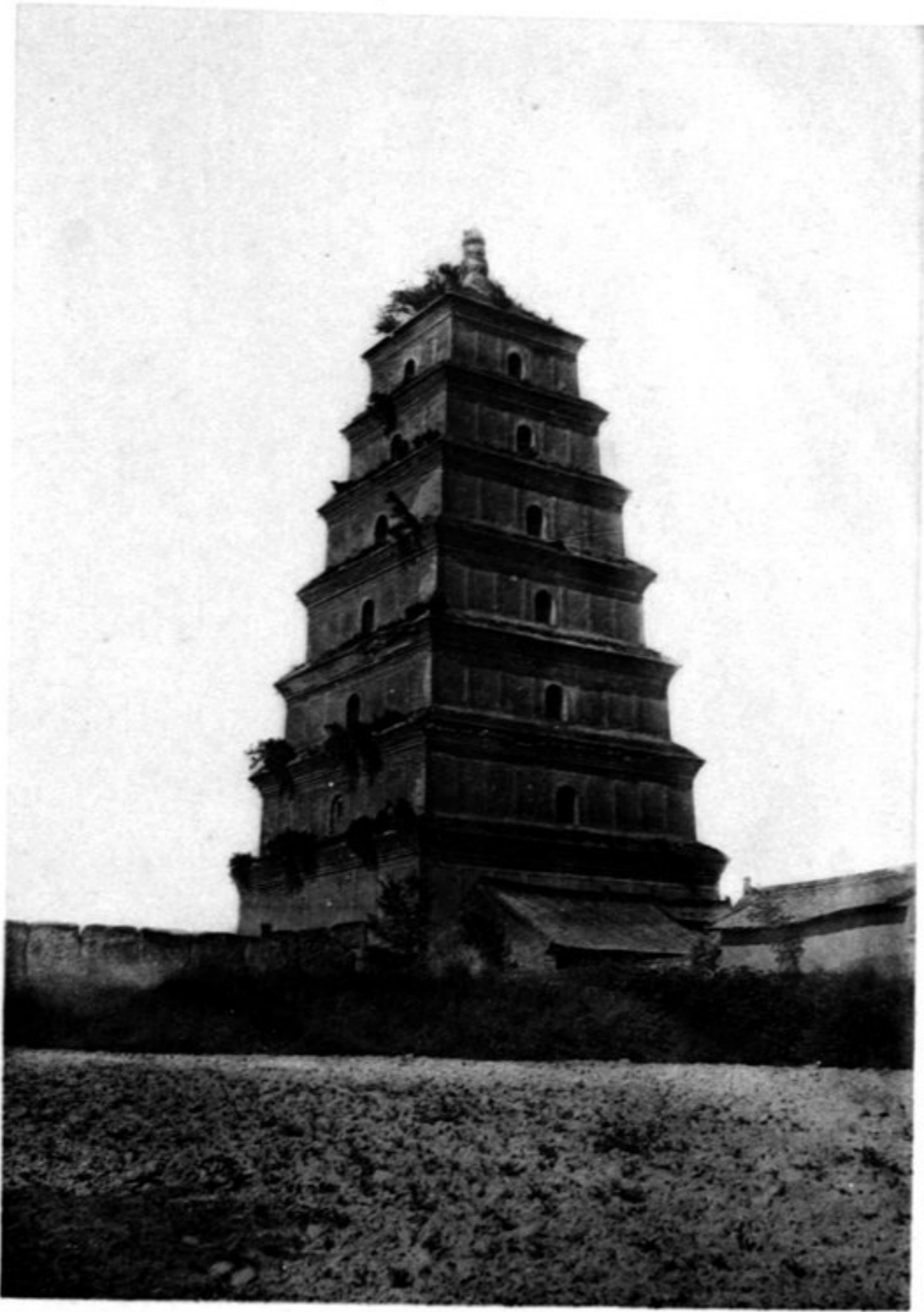
N° 1024 Si-ngan fou Ta yen t'a sseu (Ta ts'eu-ngen sseu)