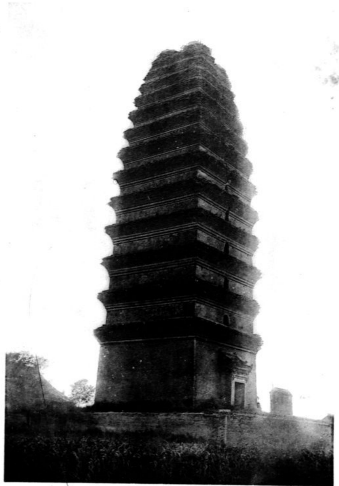
N° 1025 Si-ngan fou Siao yen t'a sseu (Tsien fou sseu)