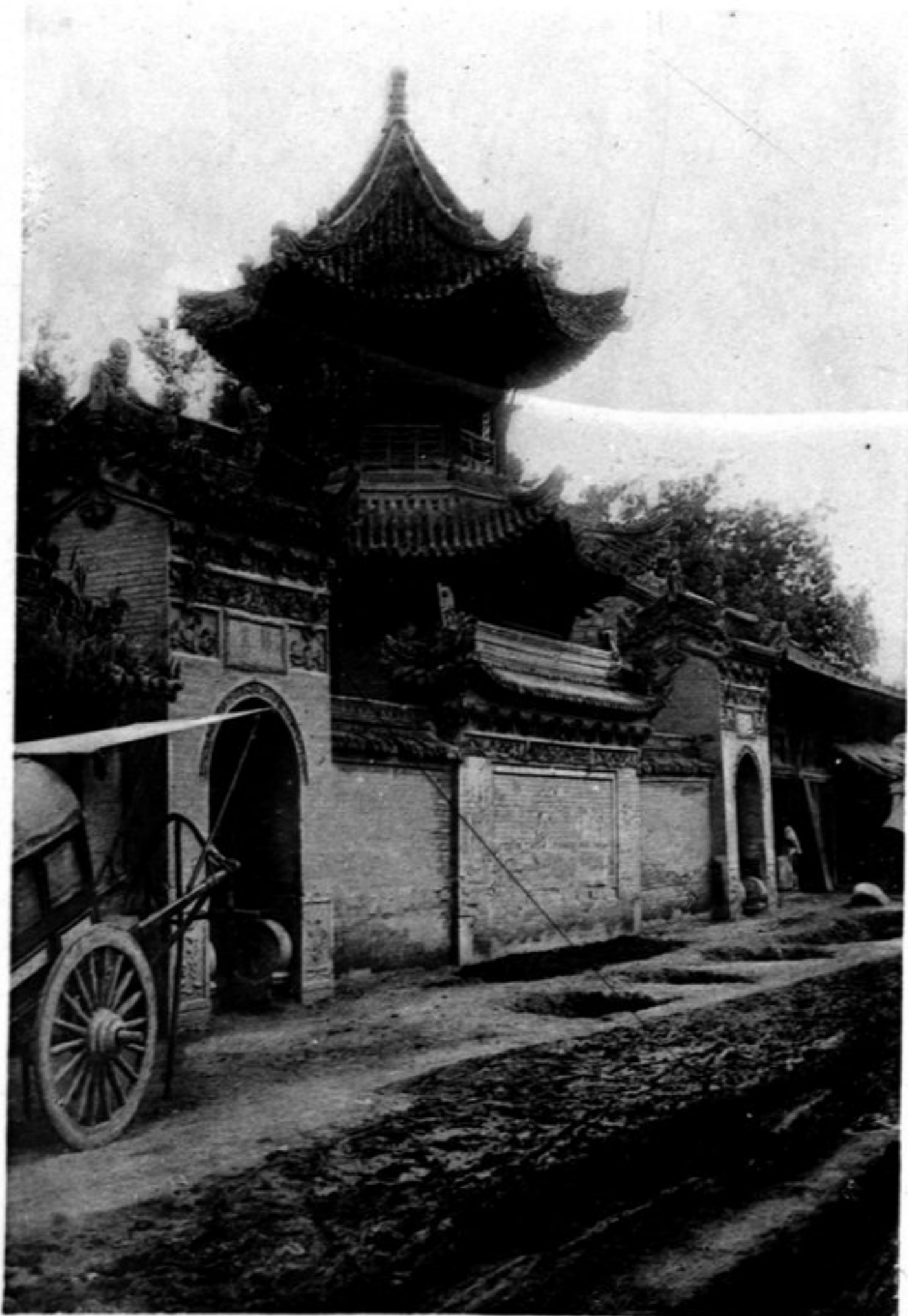
N° 1026 Si-ngan fou Mosquée située en face de la mosquée Lou ts'eu