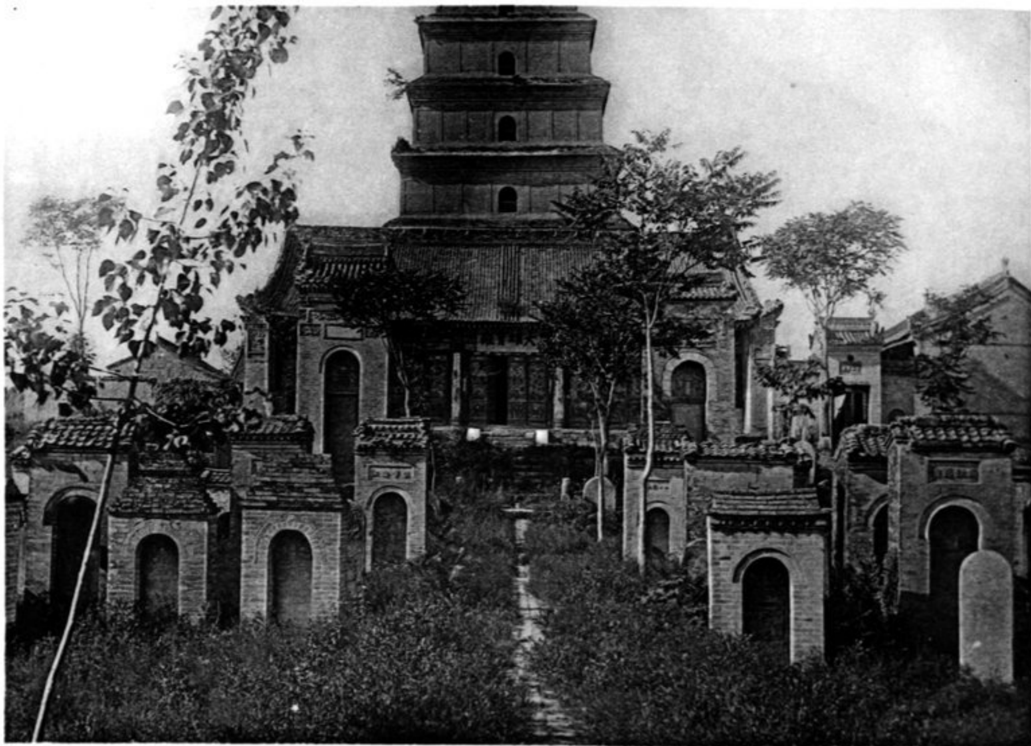
N° 1029 Si-ngan fou Ta t'seu-ngen sseu