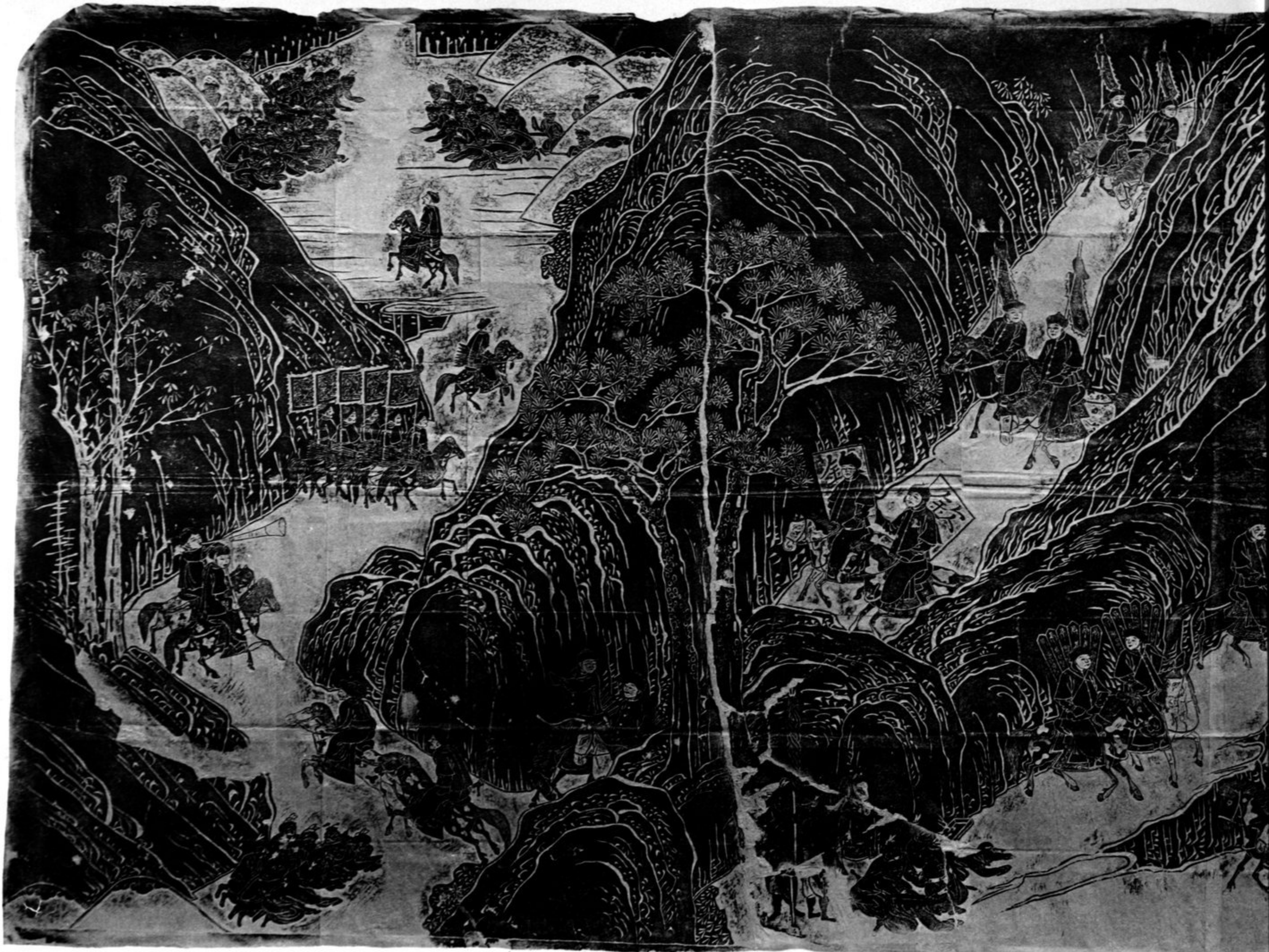
N Gravure représentant la (dans le Ta