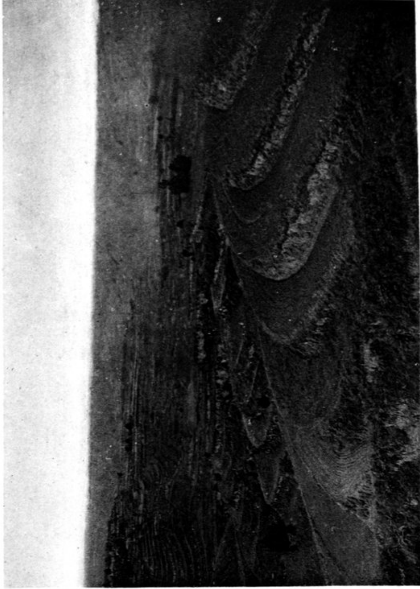
N° 1043 Paysage à l'Est de Ho-yang hien