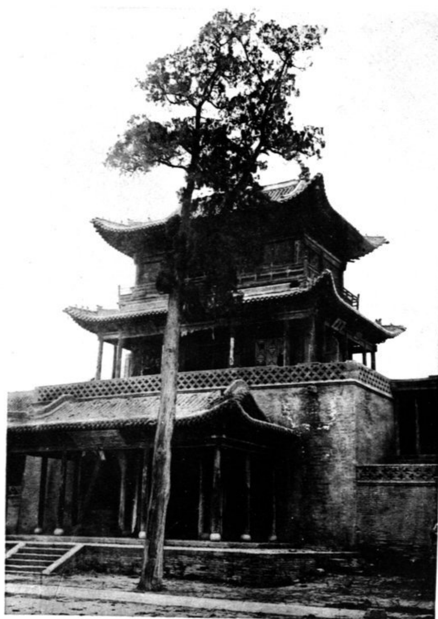
N° 1085 T'ai-yuan fou Temple Siao wou t'ai, à l'angle Sud-Est de la ville