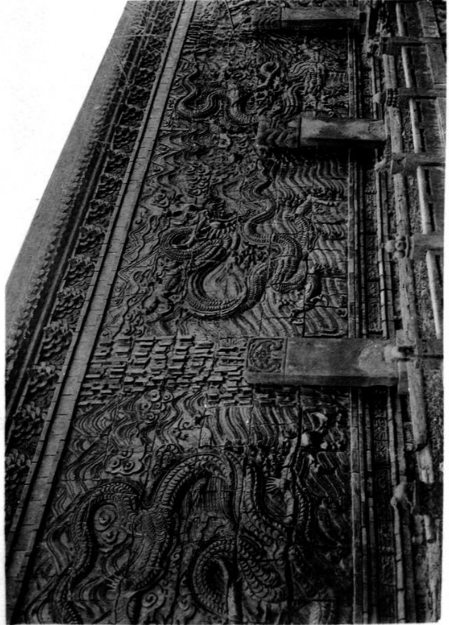
N° 1132 Ta-Tong fou Mur en briques vernissées à l'intérieur de la ville