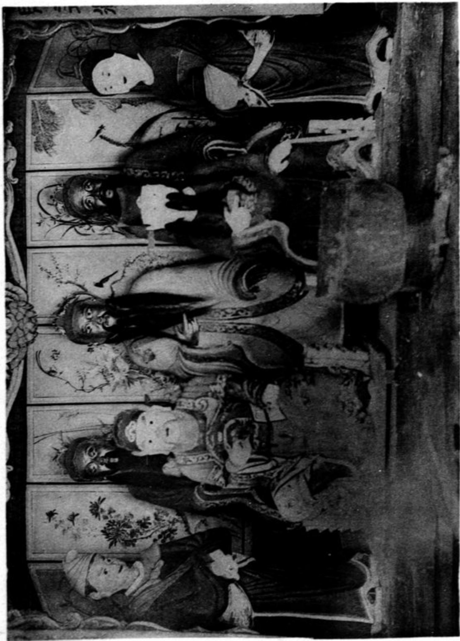
N° 1172 Les dieux de la richesse (région de Ta-t'ong fou)