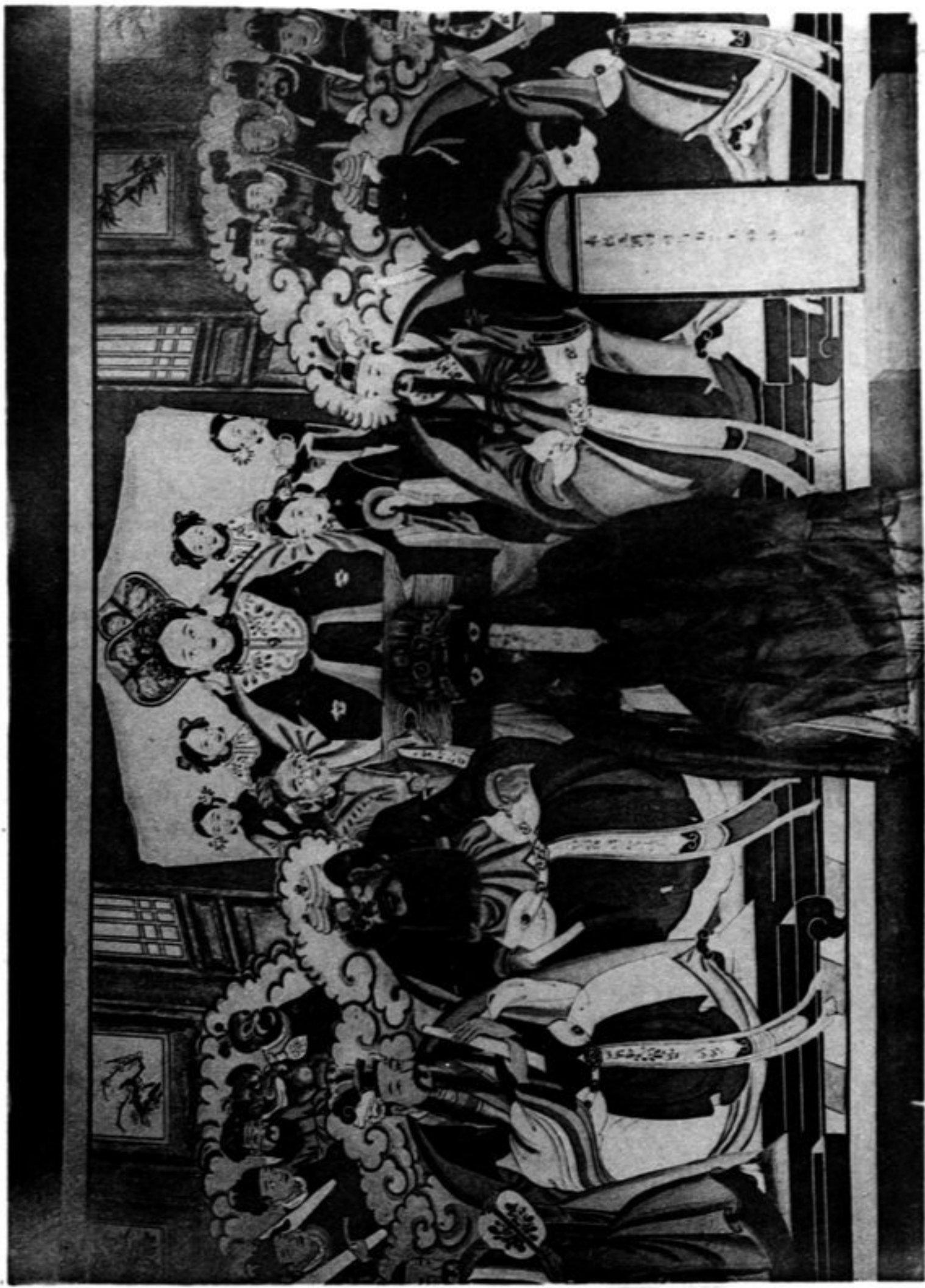
N° 1175 Peinture représentant la déesse, les cinq Rois-dragons et le Maître de la pluie dans un village au Nord-Est de Wou-t'ai lien (Chan-si)