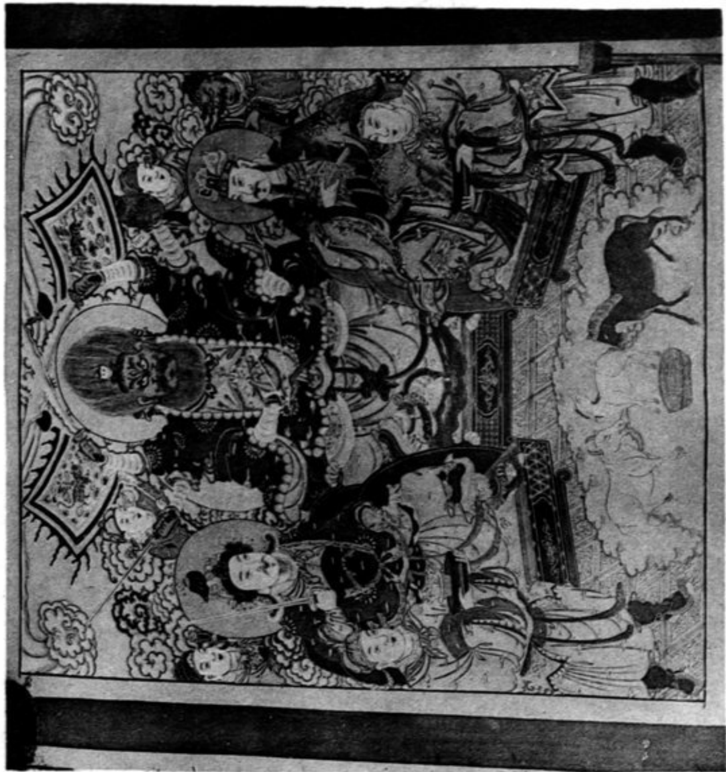
N° 1173 Peinture à droite du n° 1168 Le Ma wang (Roi des chevaux)