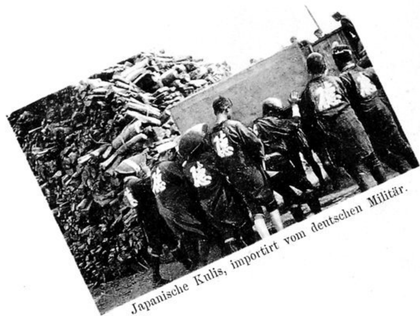
Japanische Kulis, importirt vom deutschen Militär.