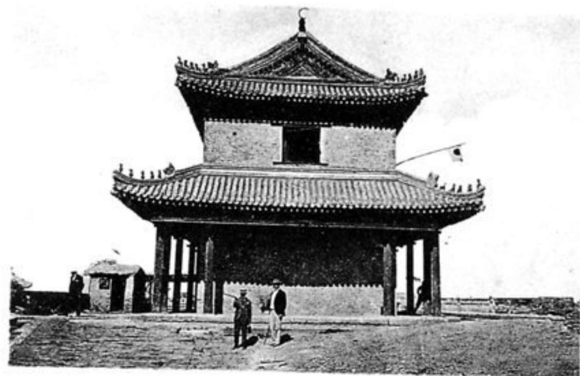
Auf der Stadtmauer.