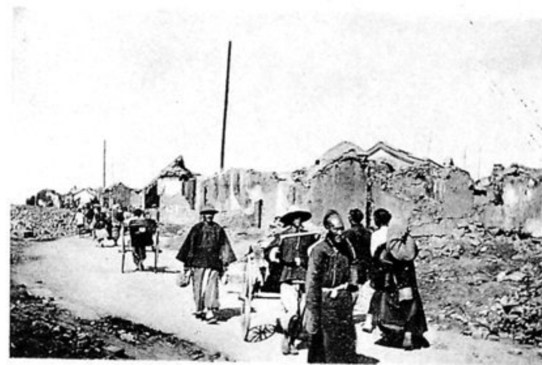
Zwischen Chinesenstadt und Fremdenniederlassung.