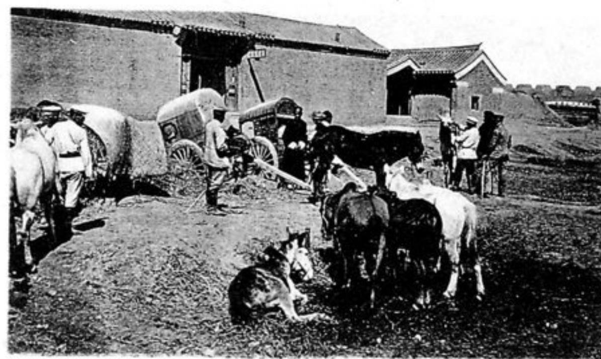
Beim Pferdehandel mit den Kosaken.