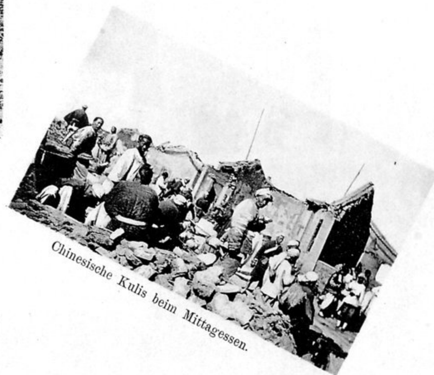
Chinesische Kulis beim Mittagessen.