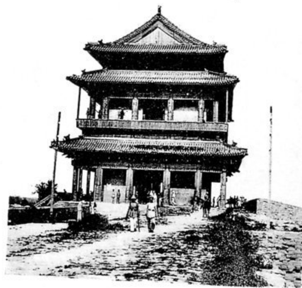
Das Hatamen. (Thurm auf der Tartarenmauer über dem Thor).