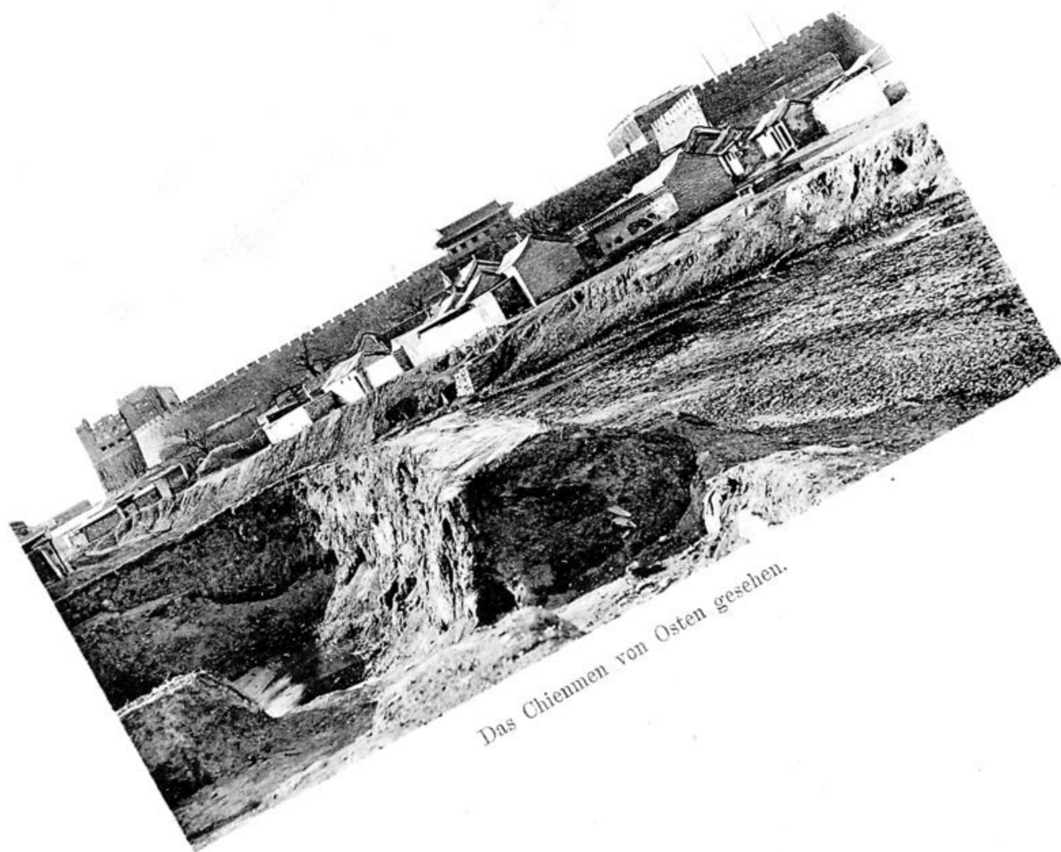
Das Chienmen von Osten gesehen.