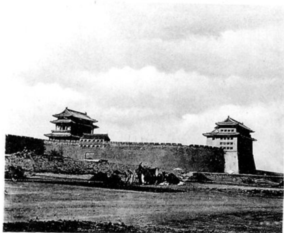
Das Antingmên von aussen gesehen.