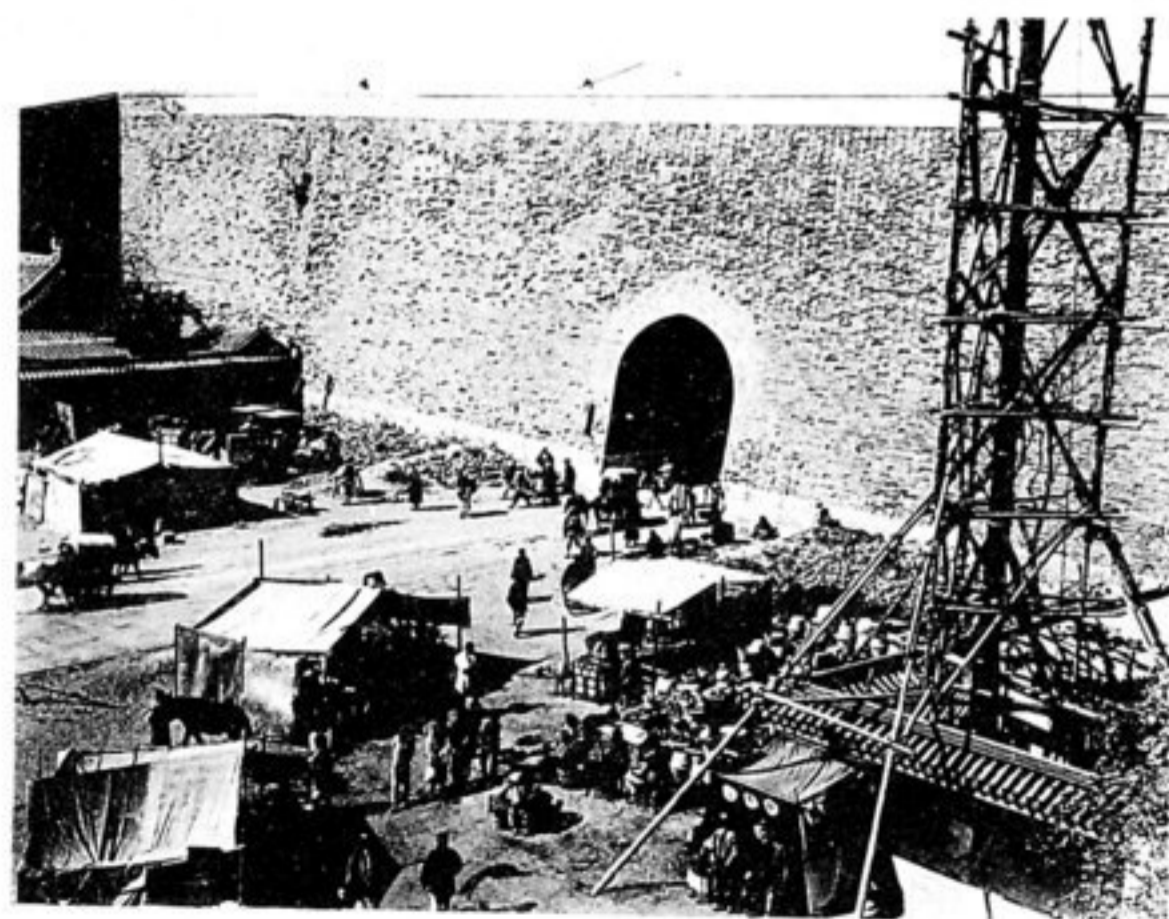
Innerer Hof des Chienmên.