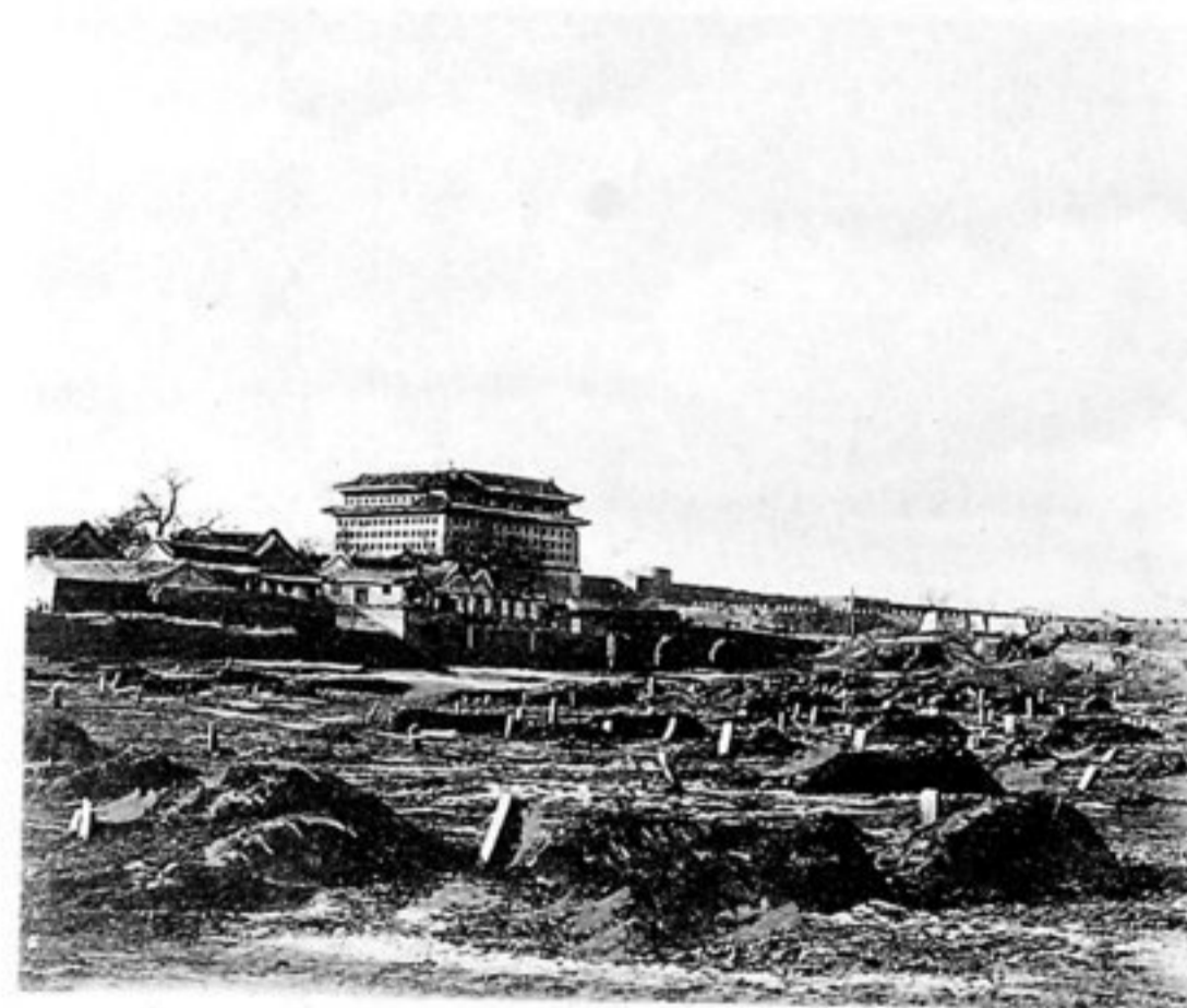
Gräberfeld in der Nordostecke der Chinesenstadt.