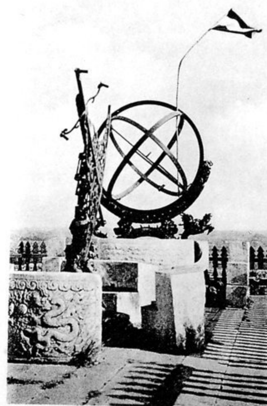
Die Beschlagnahme der astronomischen Instrumente durch deutsche und französische Truppen im Dezember 1900.