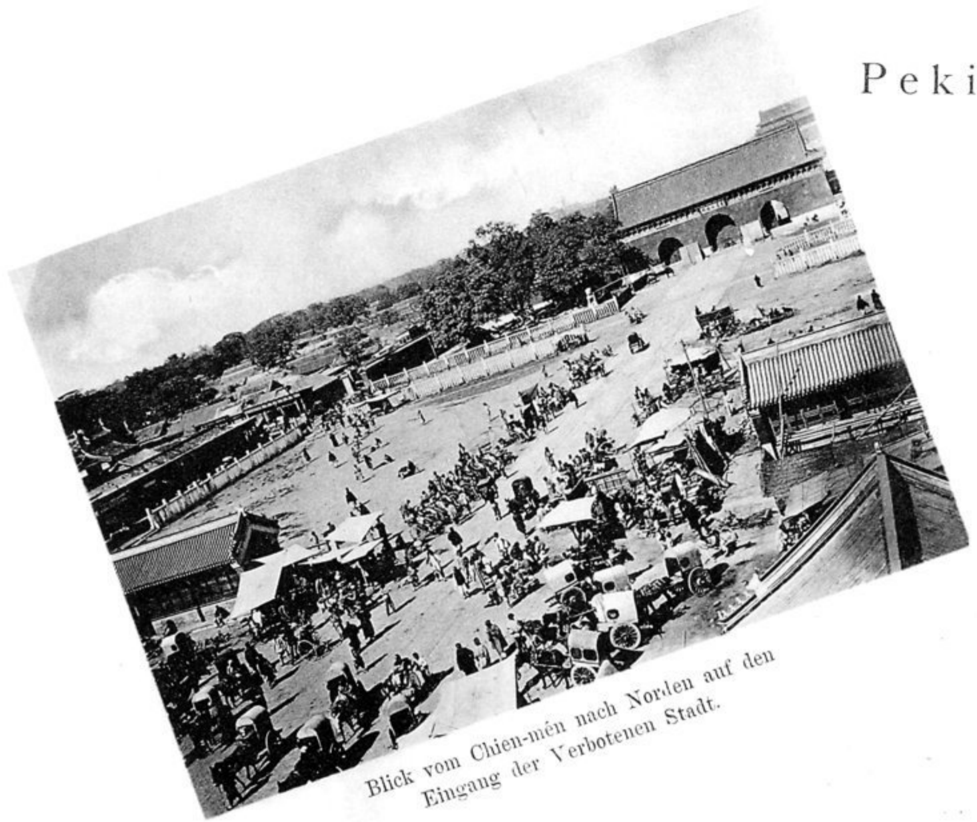
Blick vom Chien-mén nach Norden auf den Eingang der Verbotenen Stadt.