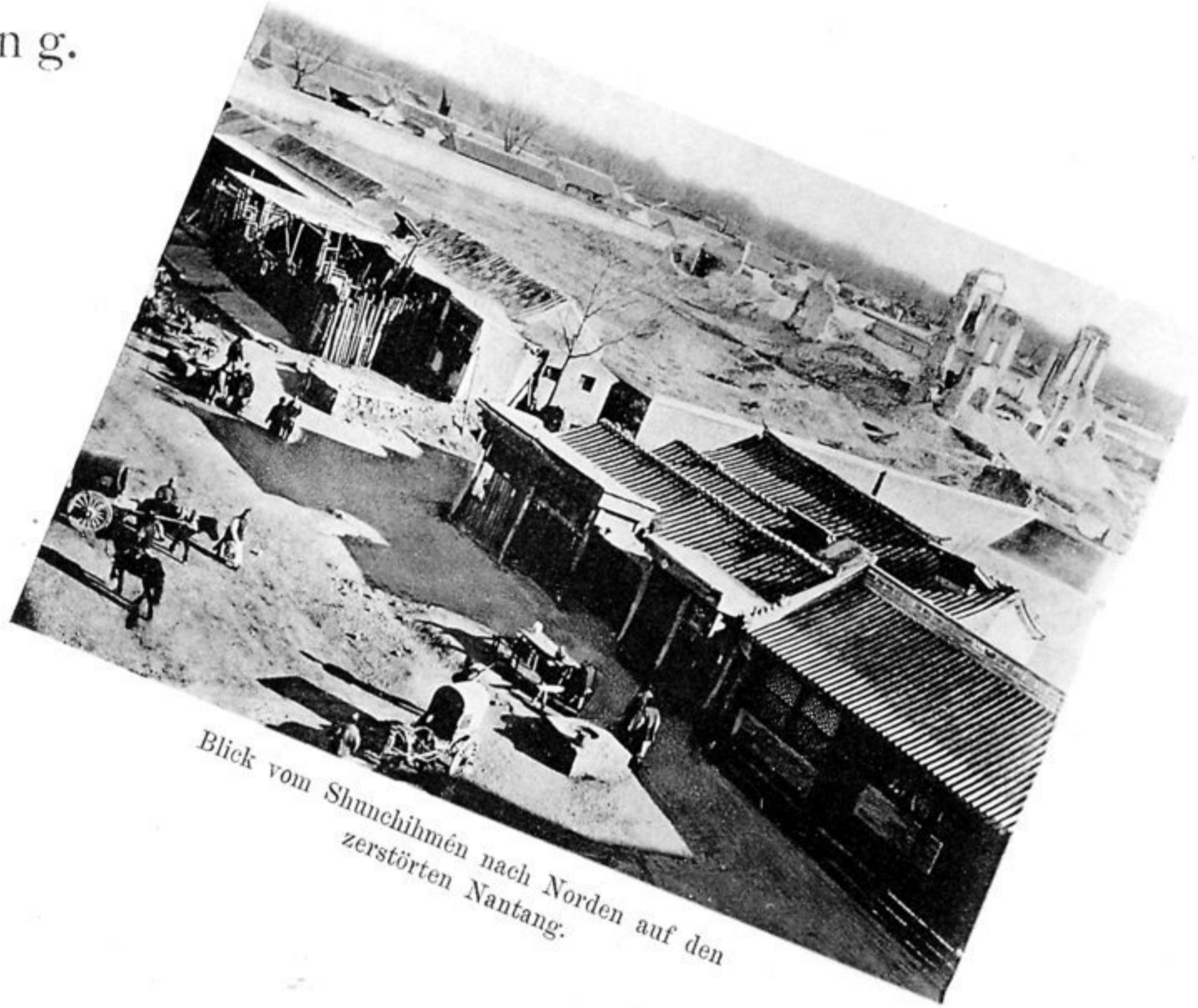
Blick vom Shunehimén nach Norden auf den zerstörten Nantang.