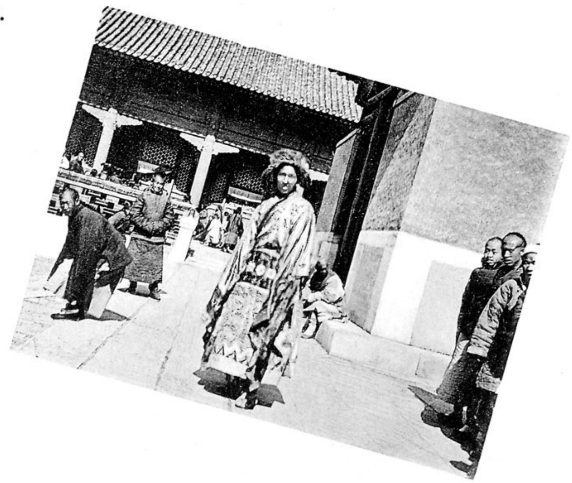
Maskirte Lamas beim Fest der Teufelaustreibung.