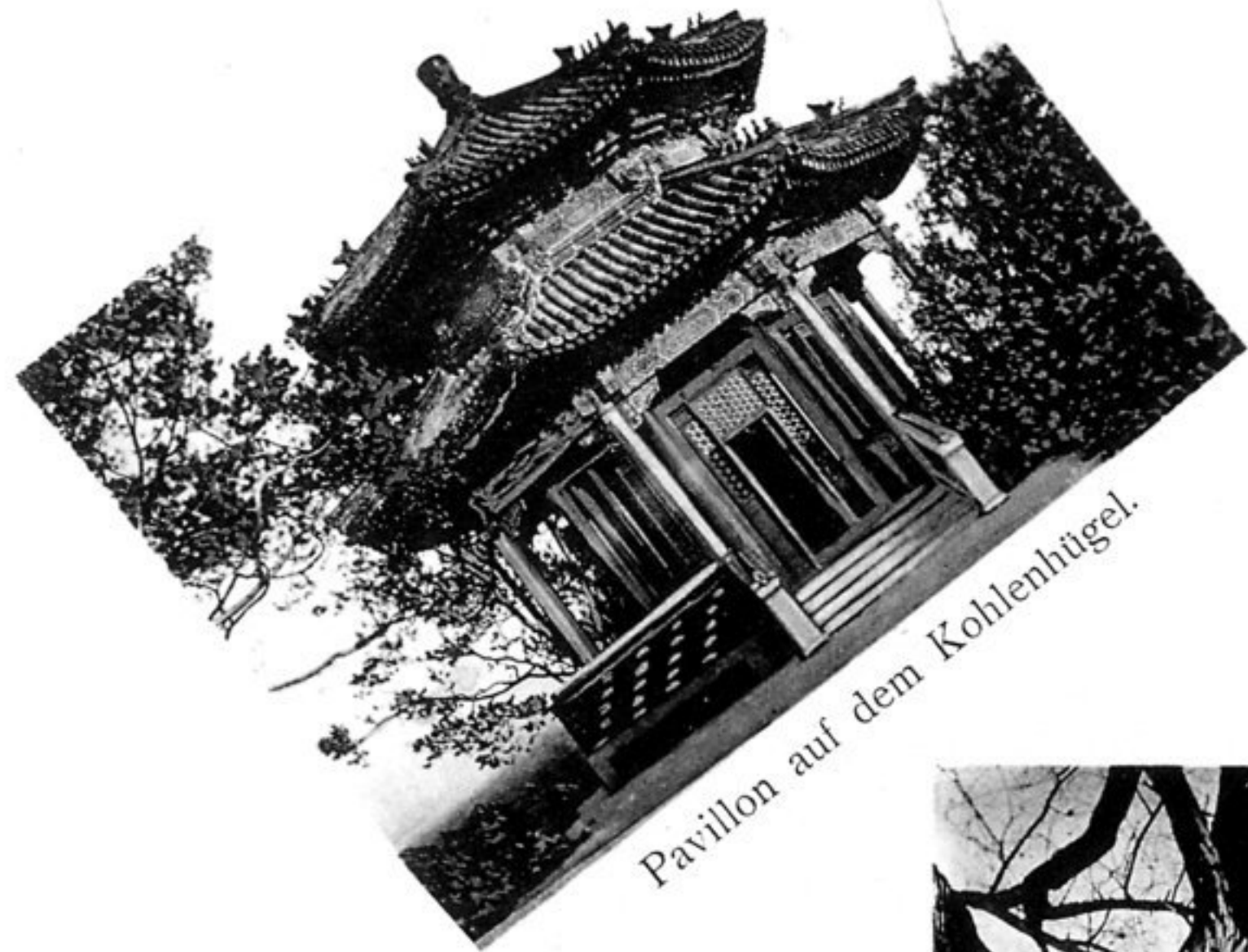
Pavillon auf dem Kohlenhügel.