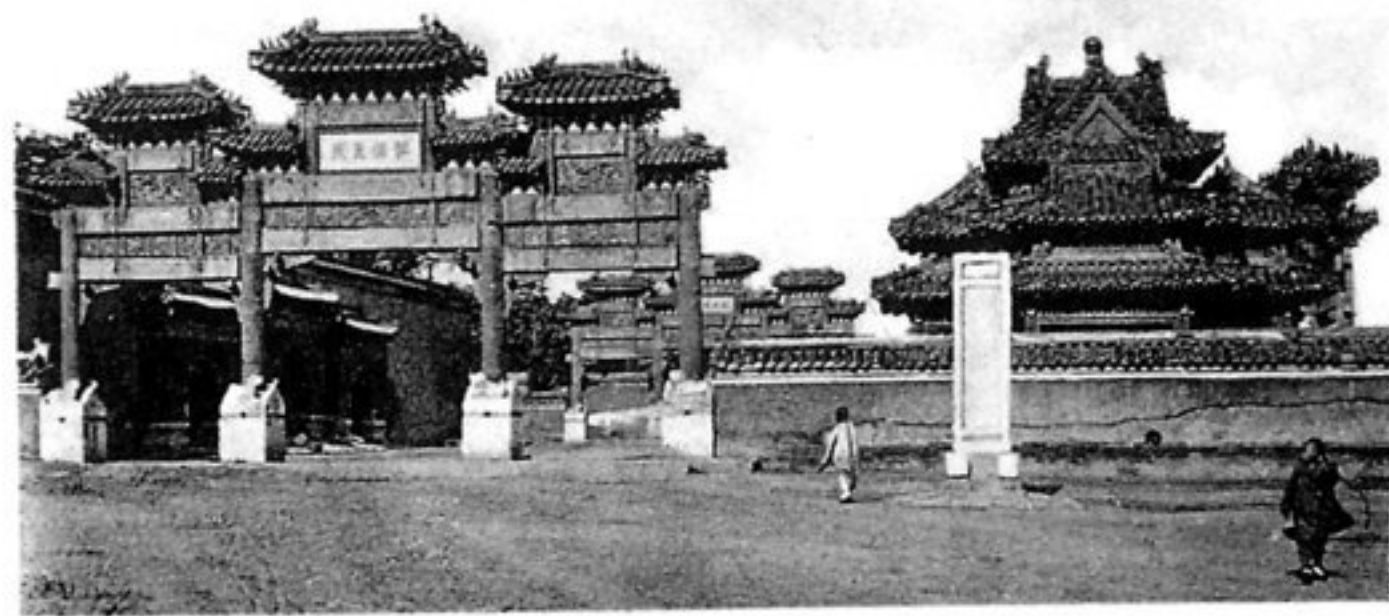
Pailou unterhalb des Kohlenhügels.