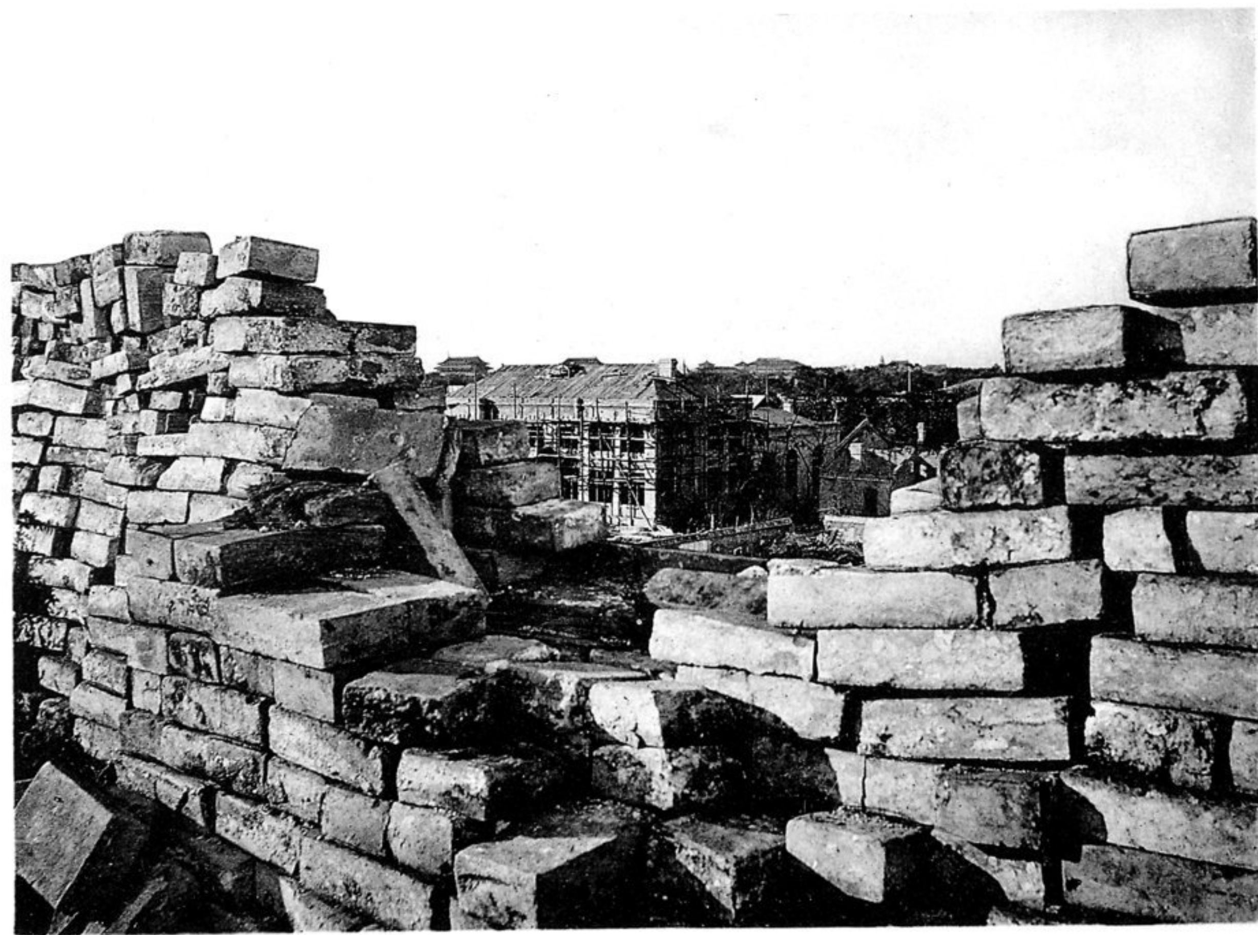
Blick von der deutschen Barrikade auf das von den Deutschen vertheidigte Gebäude des Peking-Clubs neben der Kaiserlichen Gesandtschaft.