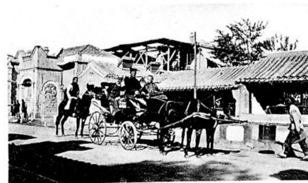
Jetzige Niederländische Gesandtschaft.