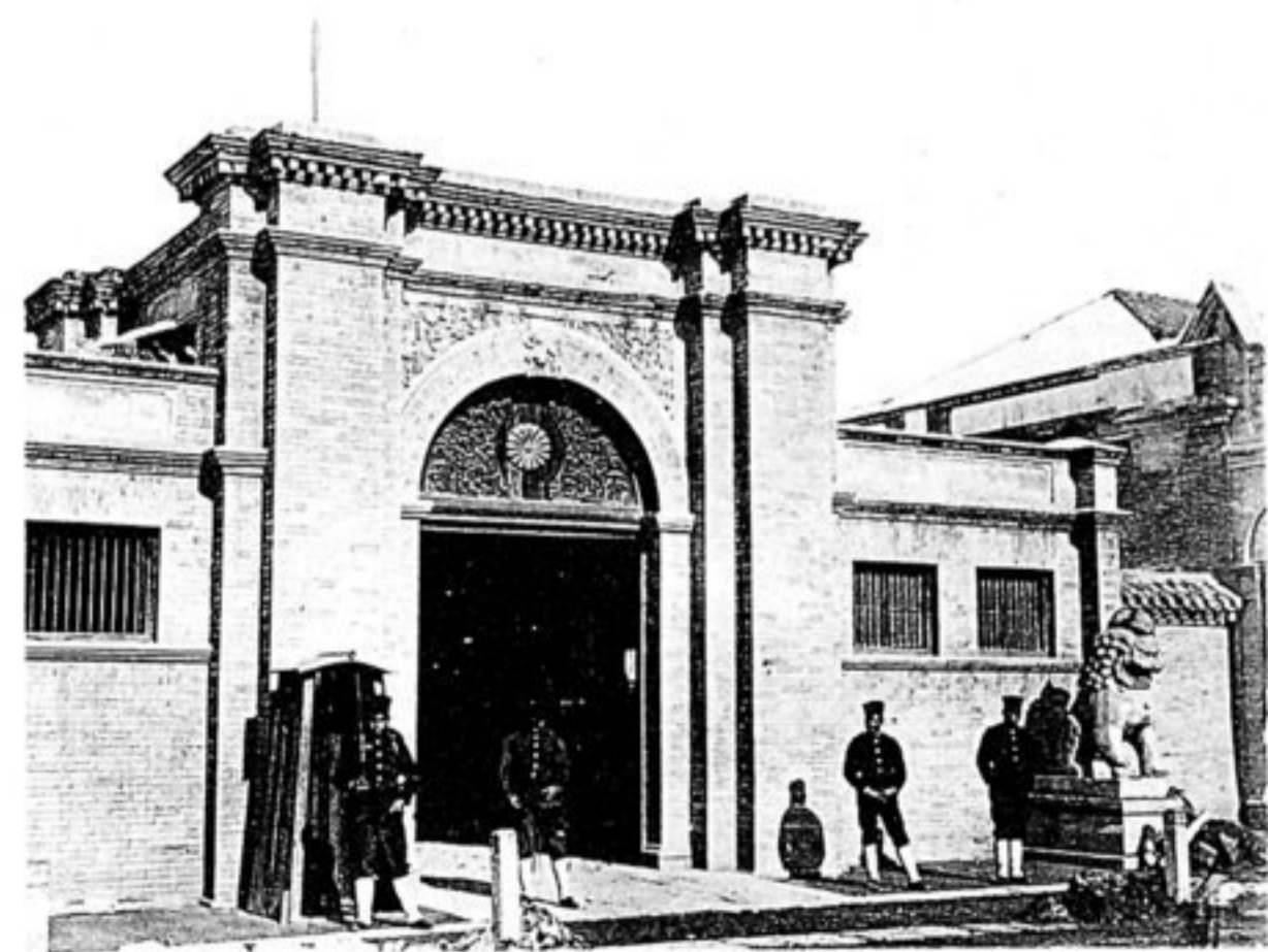
Eingang der japanischen Gesandtschaft.