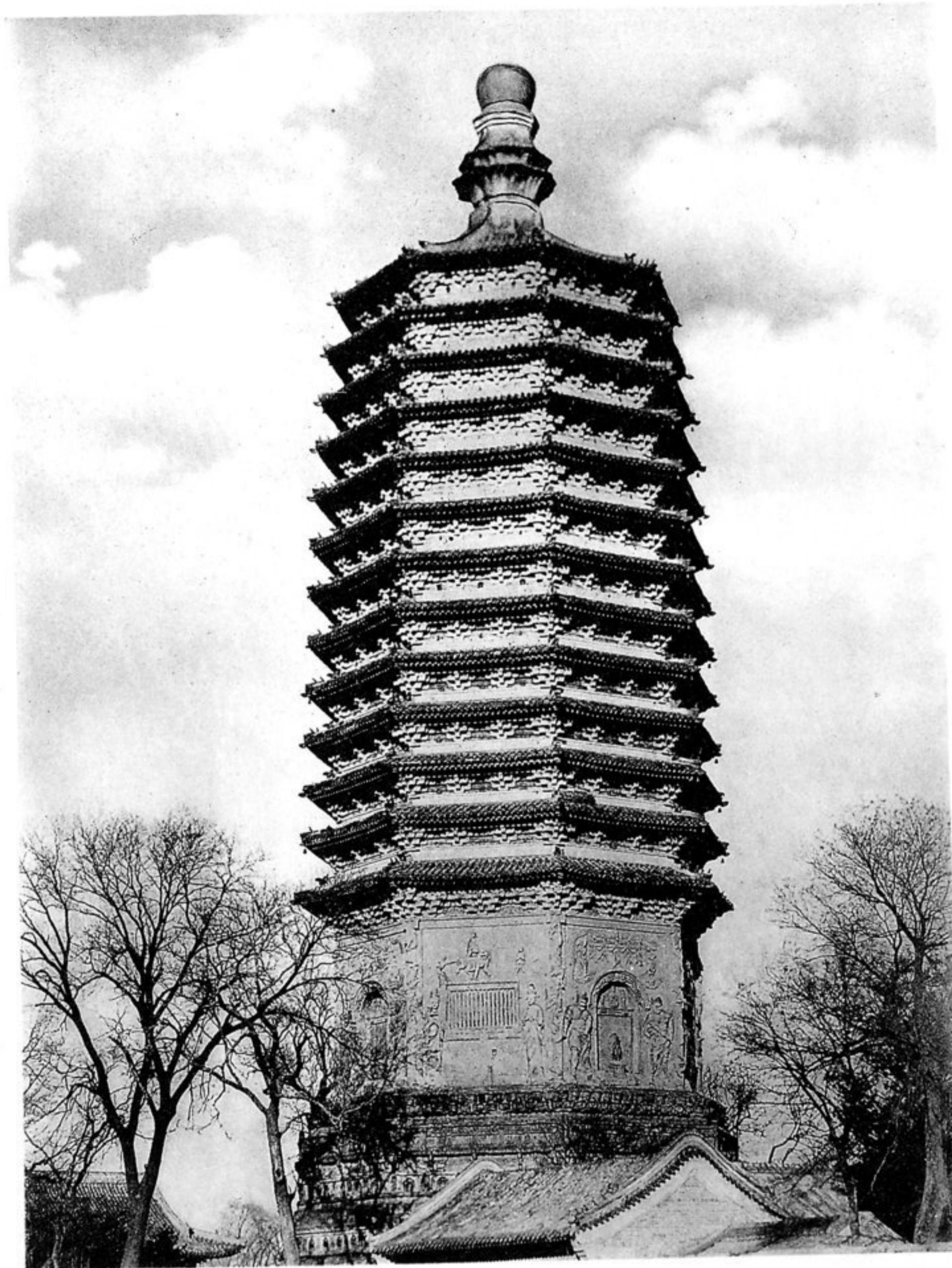
Tien-ning-sze. Tempel und Pagode vor der Westmauer.