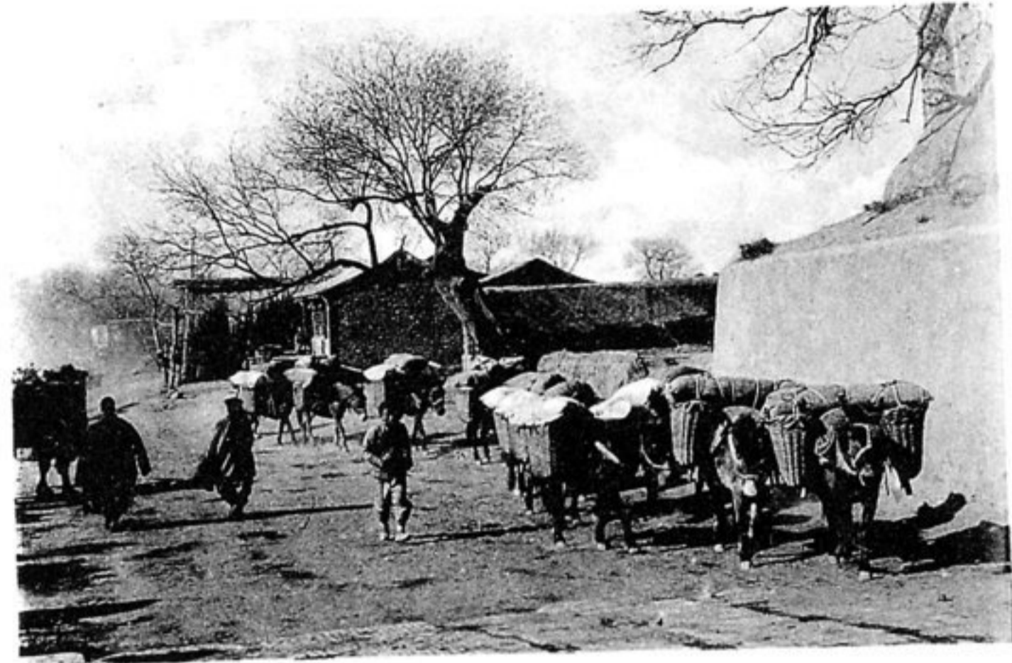
Auf dem Wege nach Tien-ning-sze.