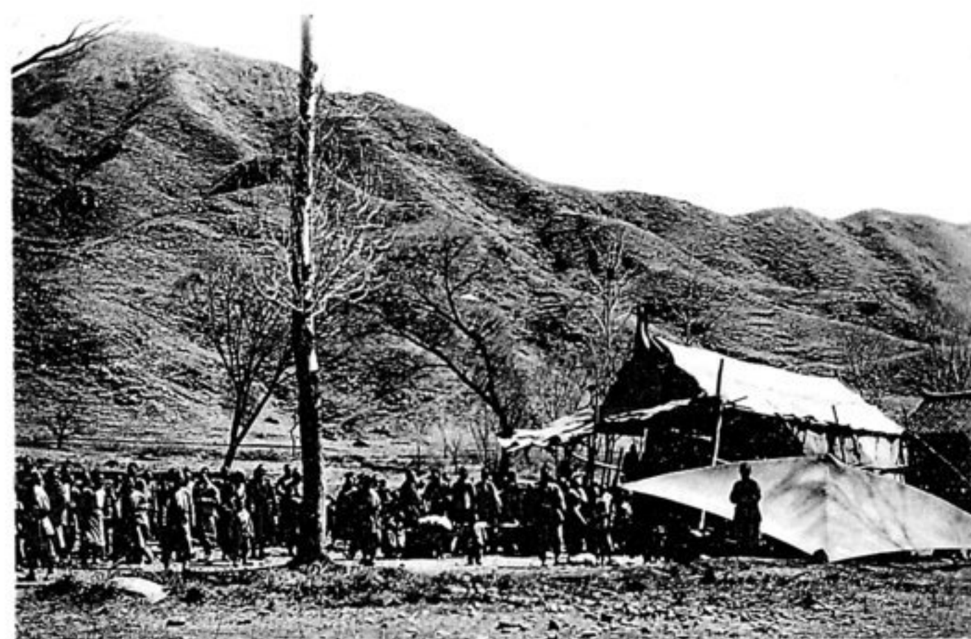
Im Thal von Talunghua. Dorftheater.