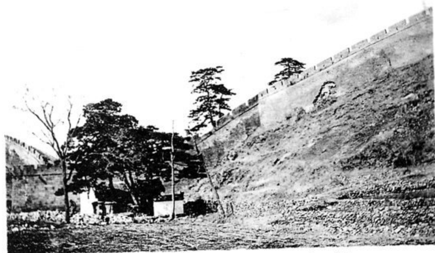
Tempel zwischen den Mauern des Forts