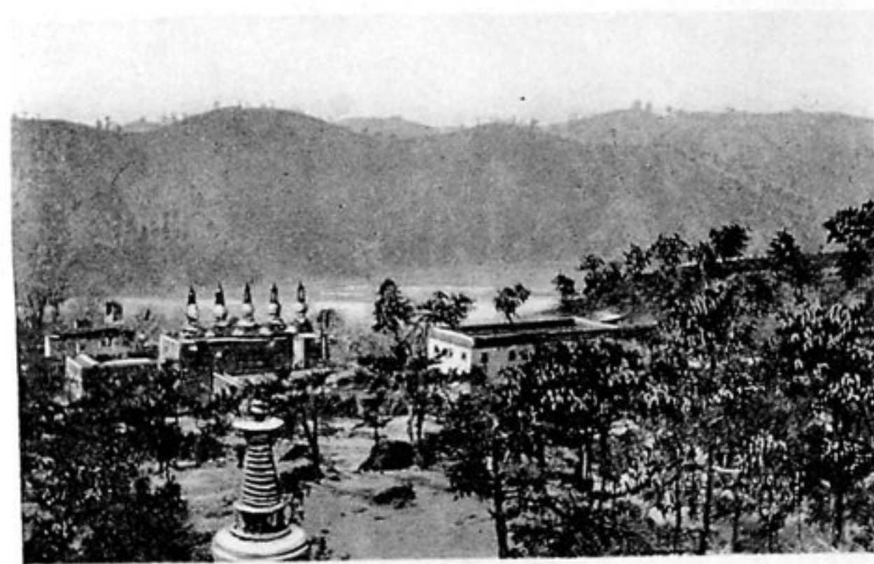
Aussicht vom Tempel auf die Nordmauer des Kaiserlichen Schlossparks.