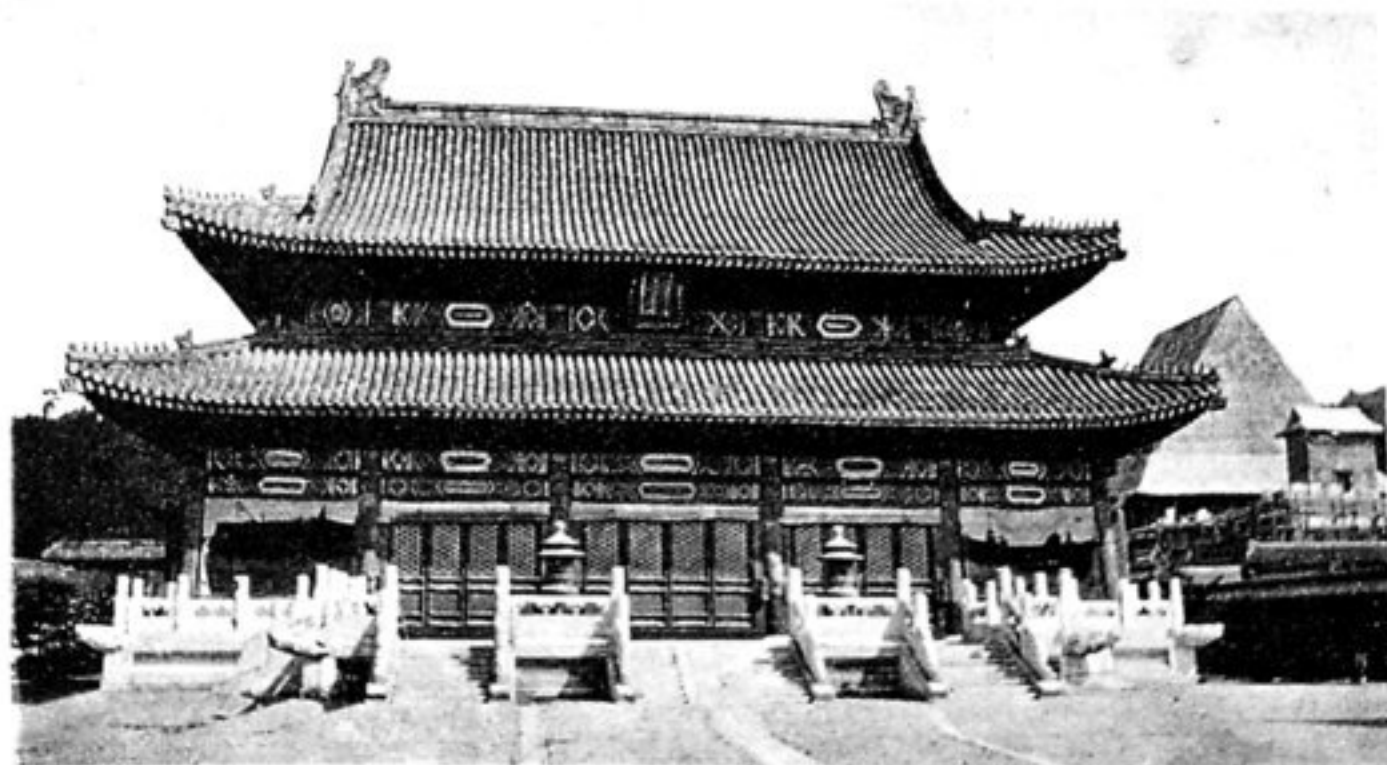
Die Haupthalle des Grabes der verstorbenen sogen. „Östlichen Kaiserin“, Vorbild für nebenstehende Halle.

Das im Bau befindliche Grab der Kaiserin Regentin Tszê-hsi, zugerüstet für den Besuch des Hofes im April 1902.