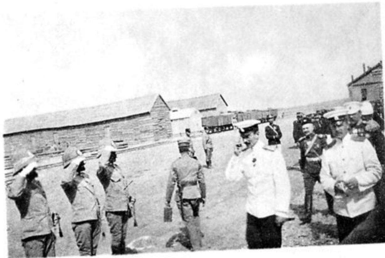
Grossfürst Boris in Tientsin.