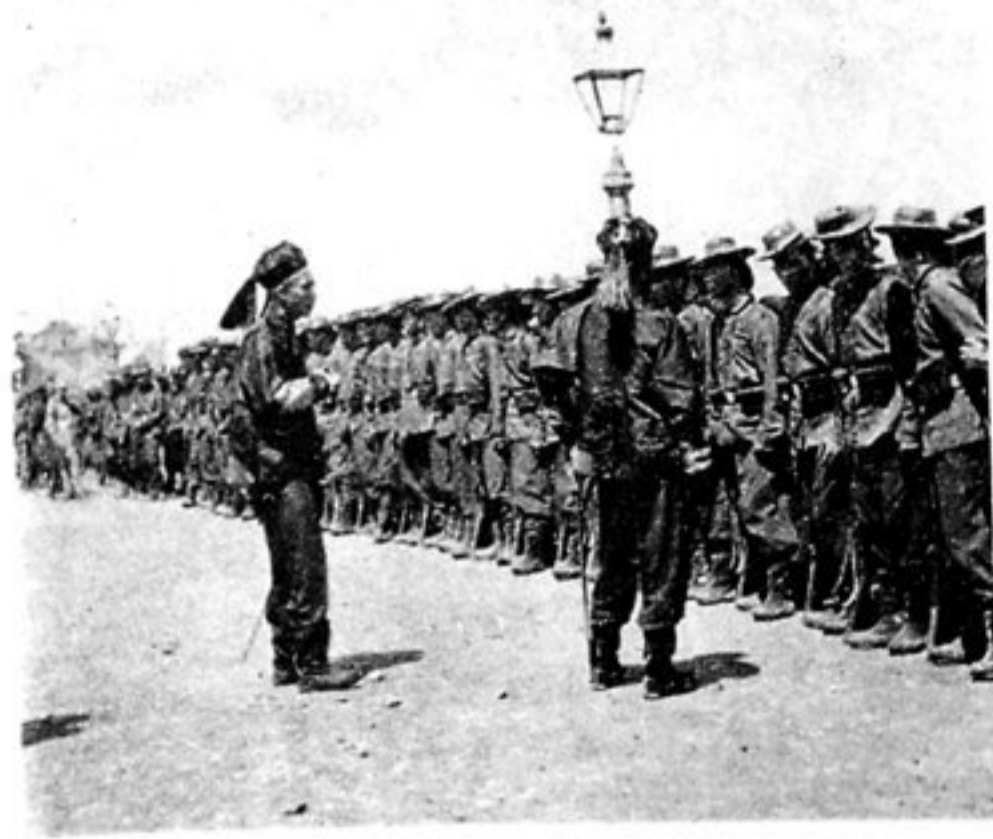
Kompagnie Yuanschikai Truppen.