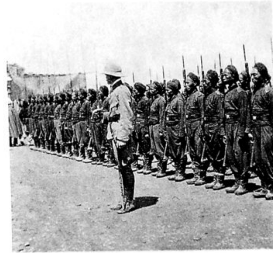
Polizisten-Kompagnie der Tientsiner Provis. Regierung.