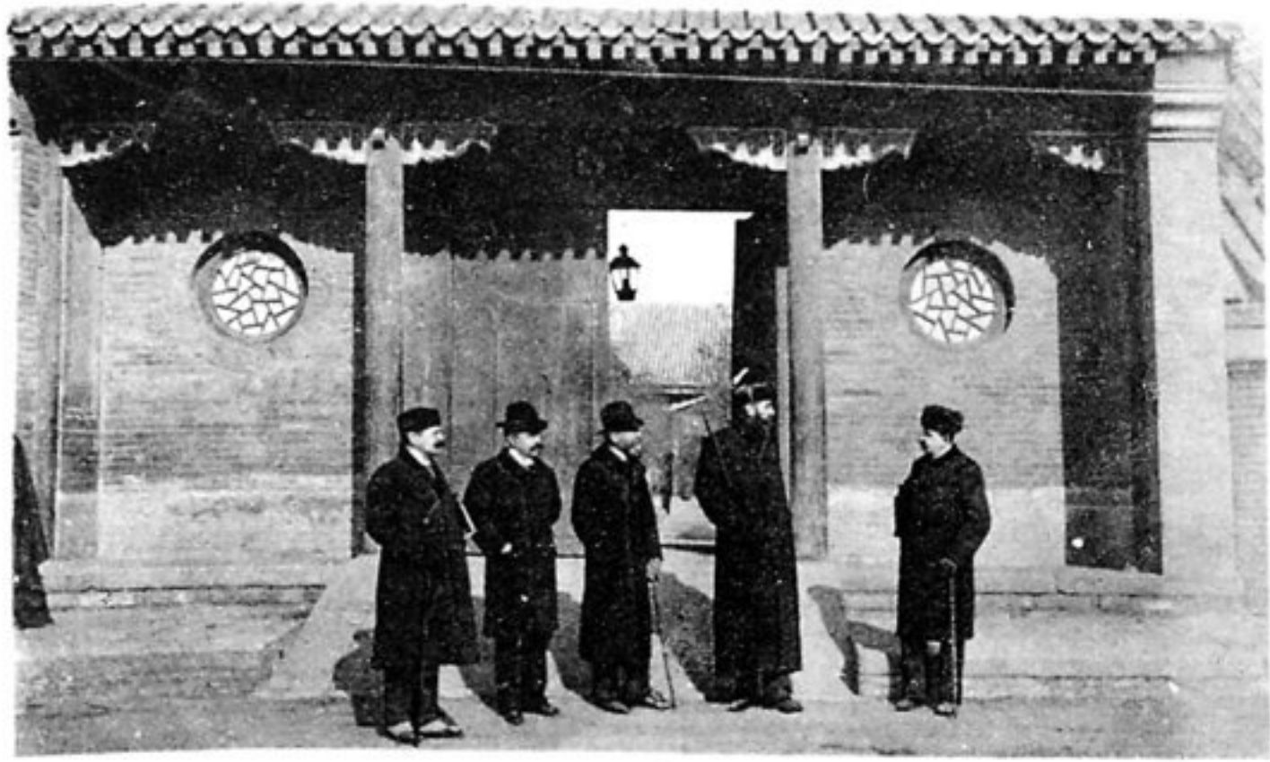
Nach der Sitzung.