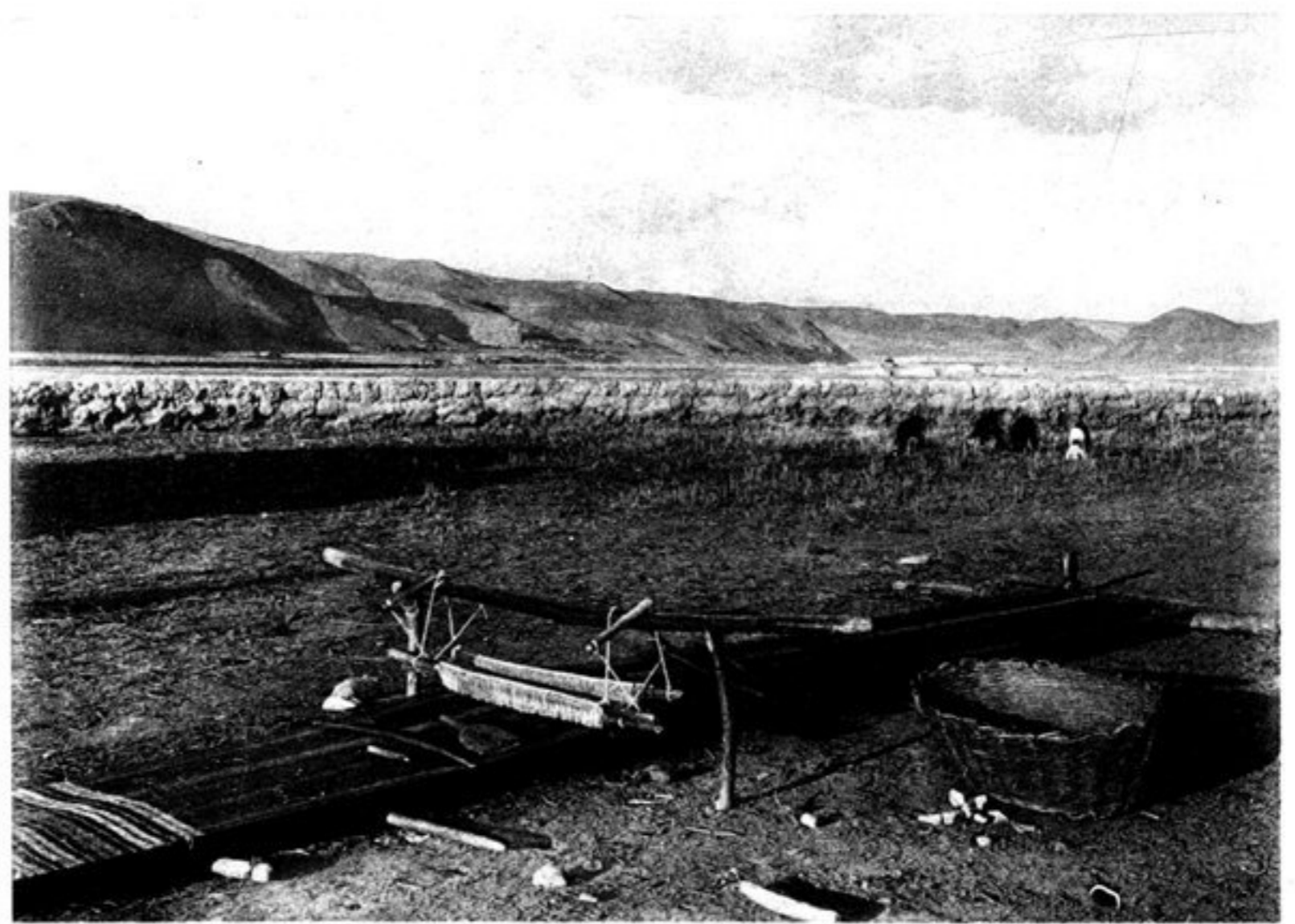
f) MÉTIER A TISSER DU HAZARAJAT.