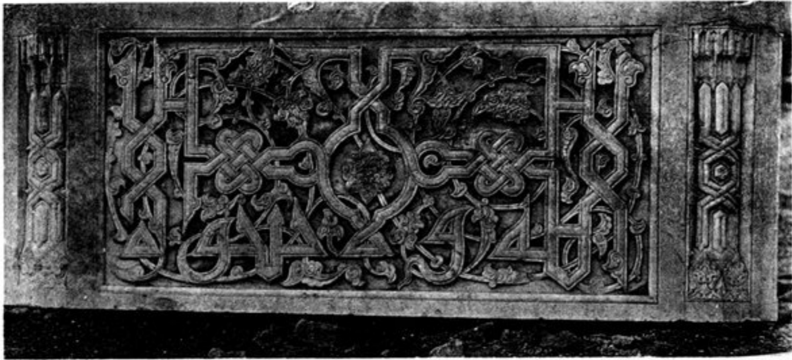
c) PANNEAU DÉCORATIF D'UN MINARET