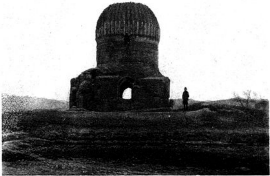
d) DOME-DES-BERGERS A HÉRAT.