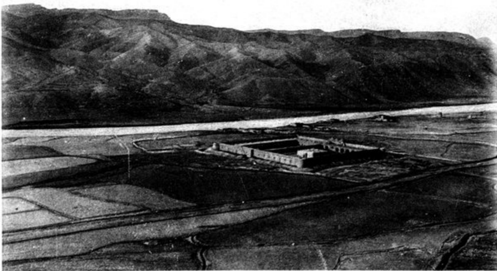
e) CARAVANSÉRAÏ DANS LA VALLÉE DE TAGAO-ISHLAN.