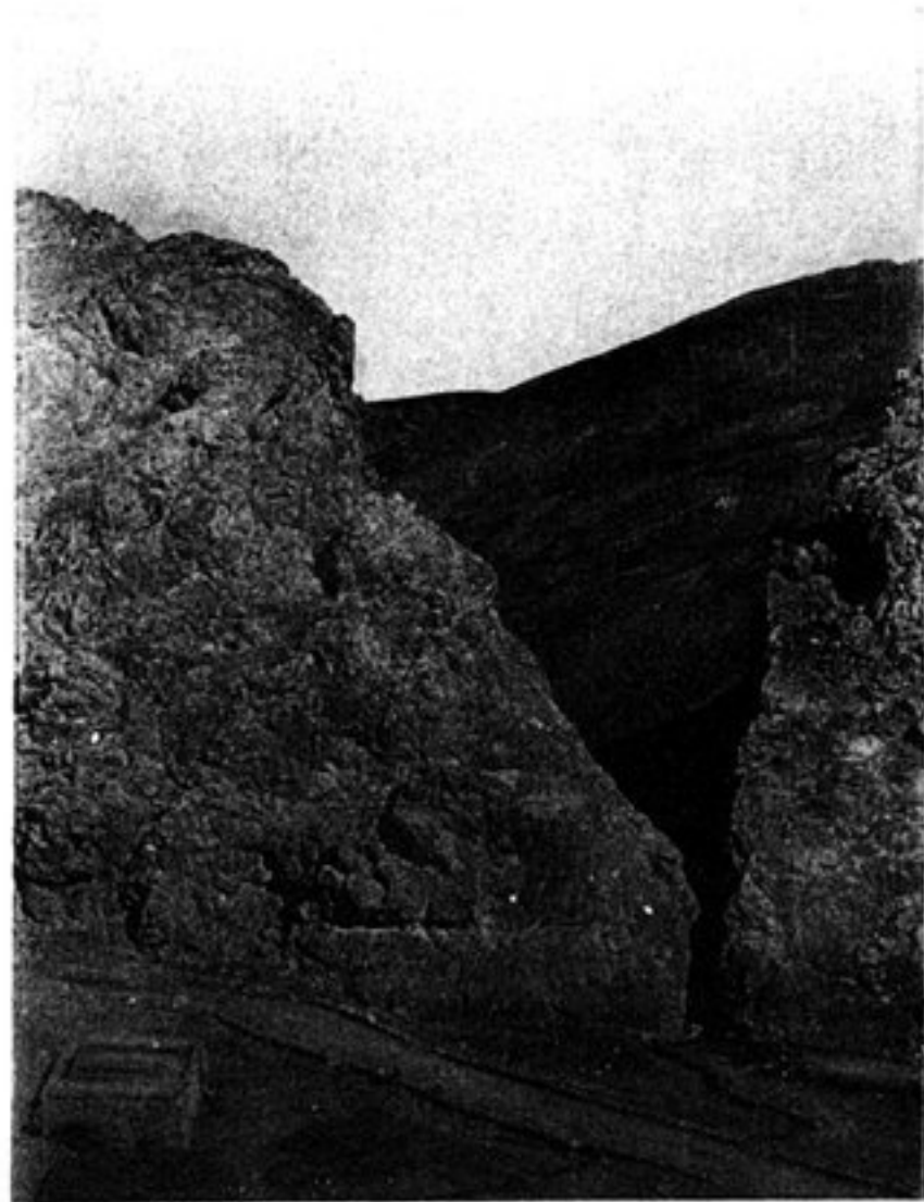
e) LA BRÈCHE DU HAUT GHORBAND.