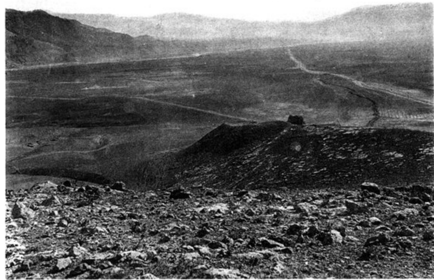
f) LA VIEILLE ROUTE DU KAPIÇA AU LAGHMAN.