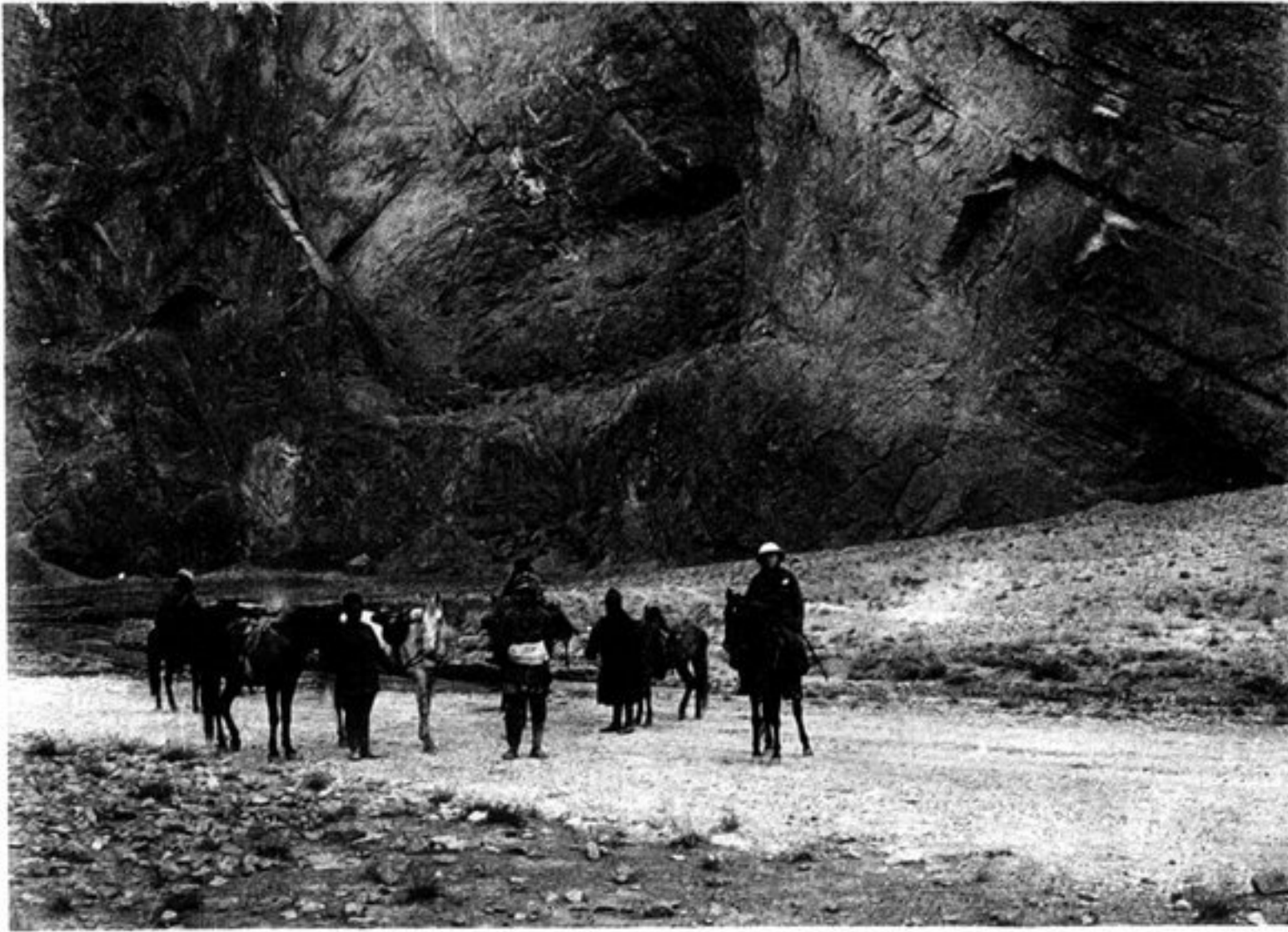
c) KAFIR-QALEH DANS LA PAROI OUEST.