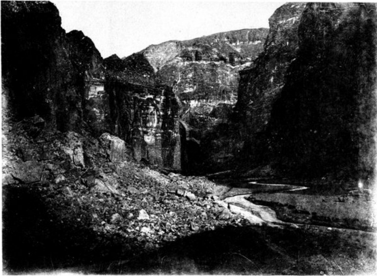
a) LES GORGES DE LA RIVIÈRE DE KHULM.