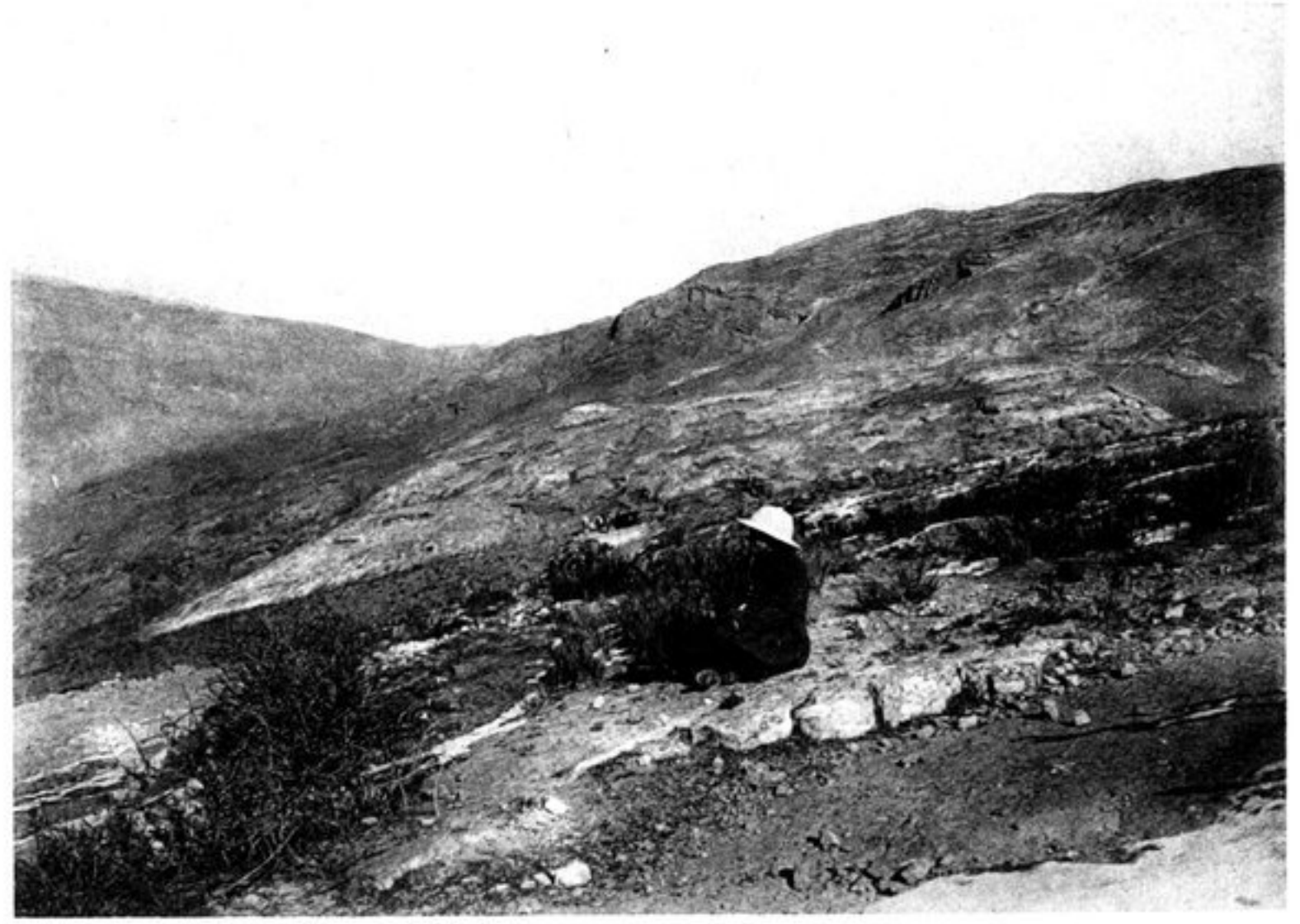
d) SUR LES PENTES NORD DU DANDAN-SHIKAN.