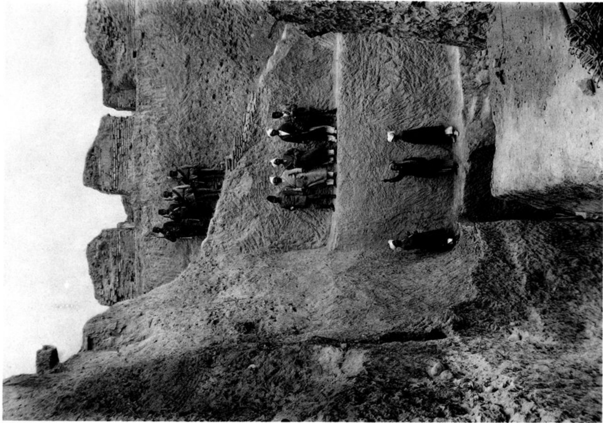
b) LA MÊME EN MARS 1925.