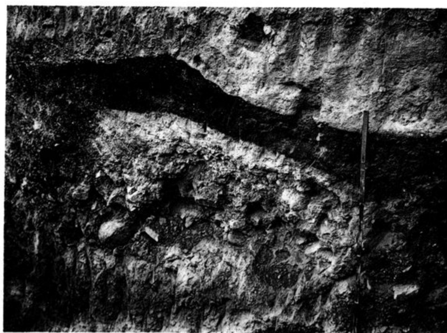
d) COUCHE DE CENDRES.