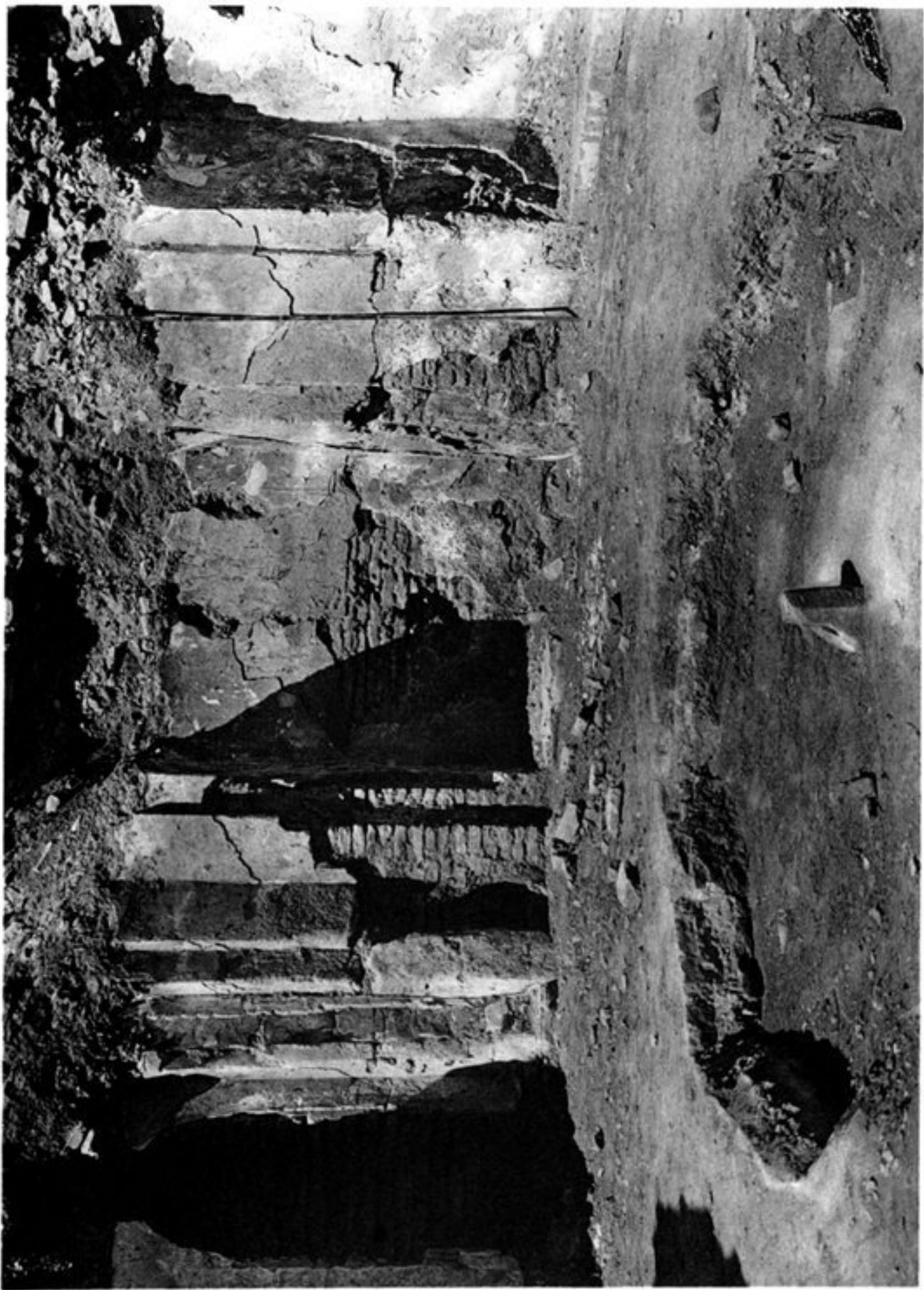
a) LA CHAMBRE AU JET D'EAU.