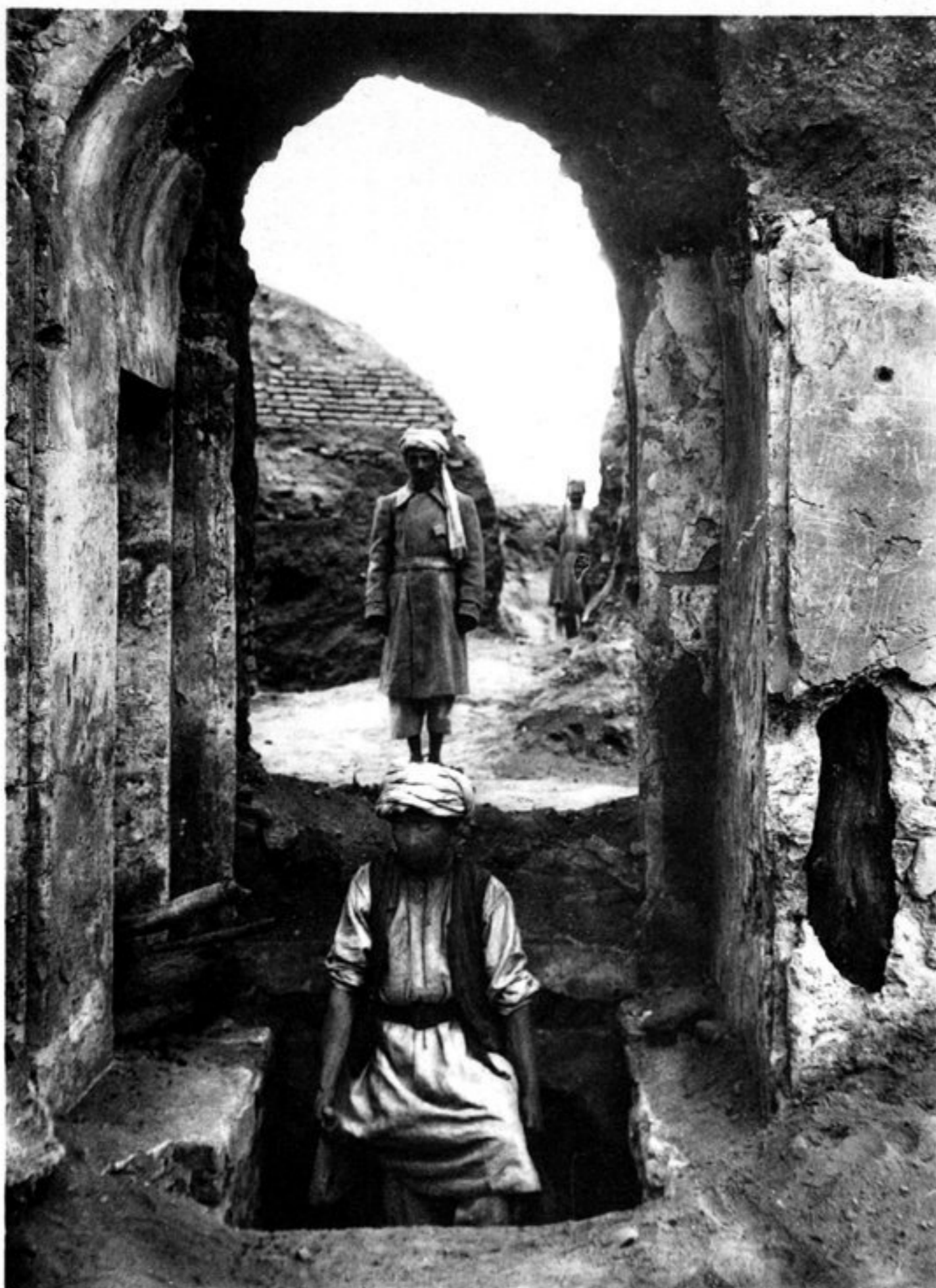
a) L'ESCALIER DU SOUS-SOL.