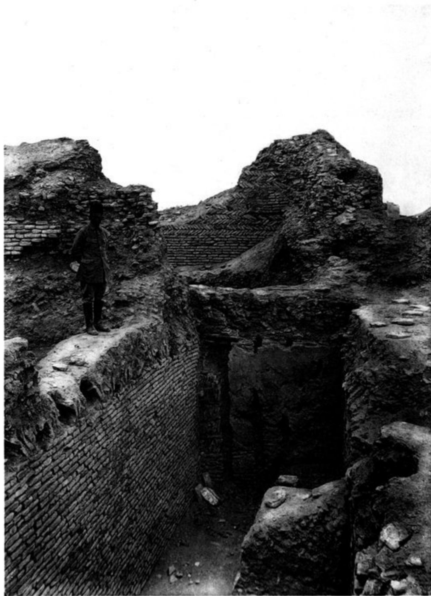
d) LA CITERNE DE L'EST.