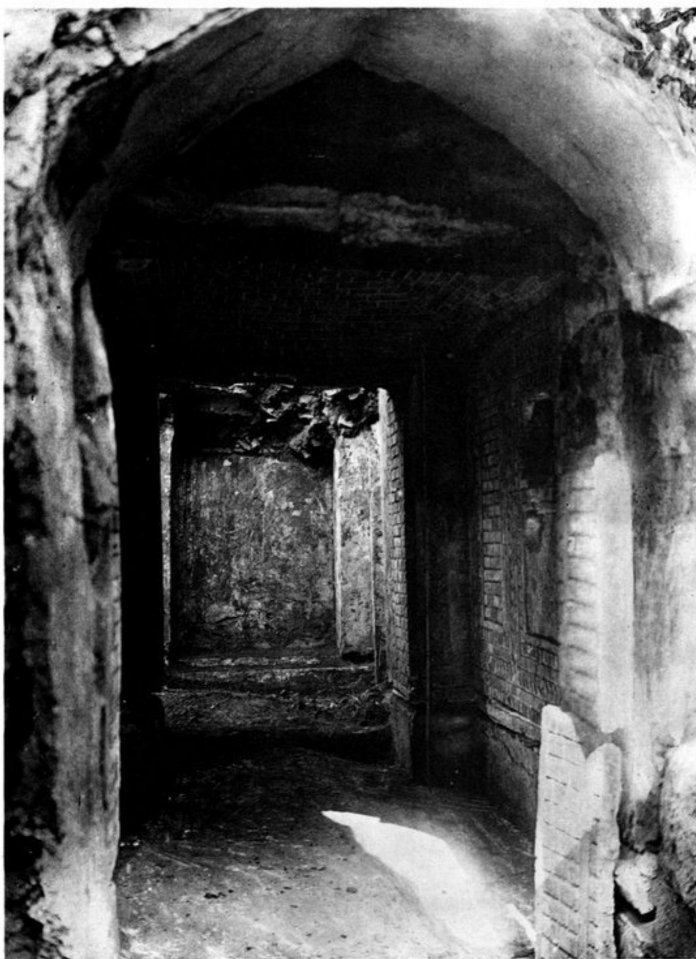
c) LA CHAMBRE TRANSVERSALE.