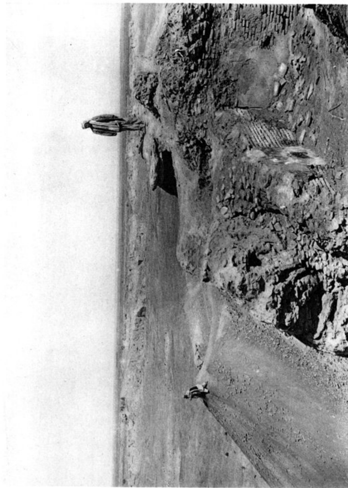
c) COIN OUEST DU CHANTIER N° 3.