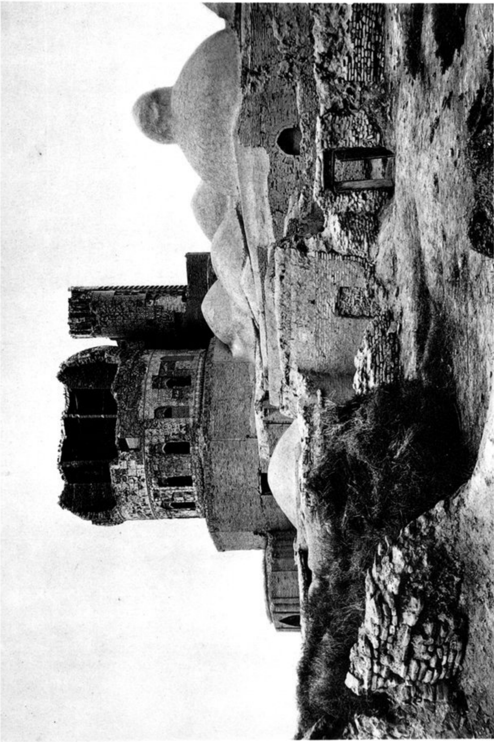
a) FACE POSTÉRIEURE DE LA MOSQUÉE-VERTE.