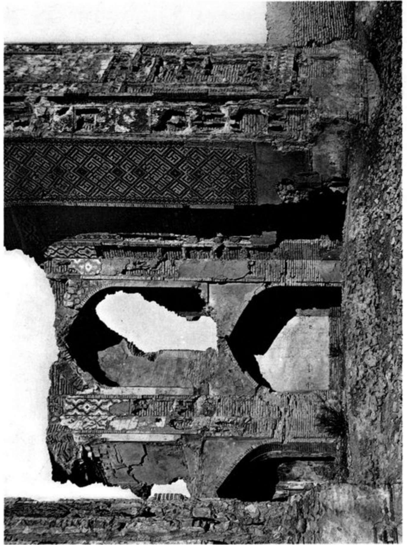
d) DÉCORATION DU COIN SUD-OUEST.