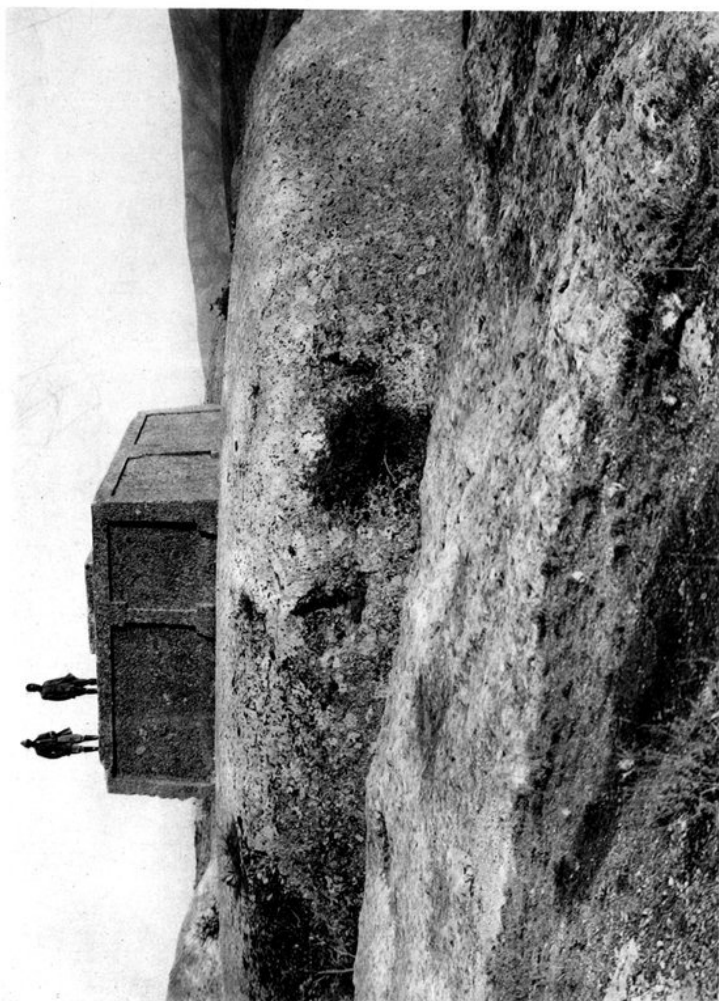
b) SOMMET DU STUPA SCULPTÉ DANS LE ROC.