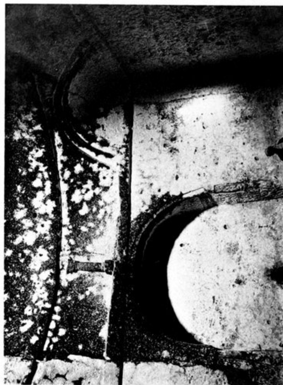
e) INTÉRIEUR DE LA CHAPELLE N° 3.