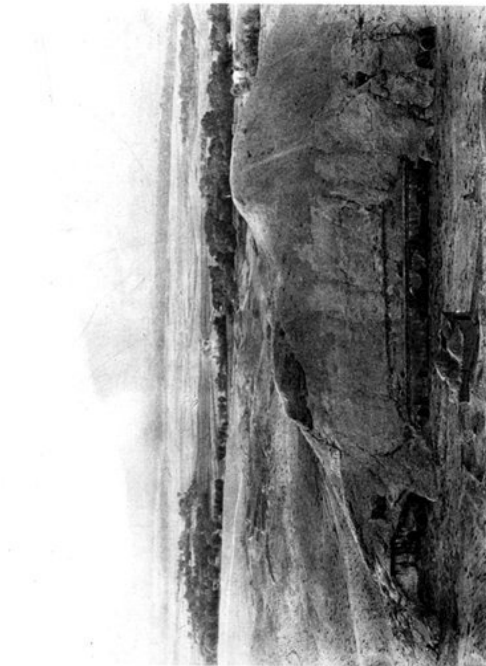
c) FAÇADE ACTUELLE DU COUVENT.