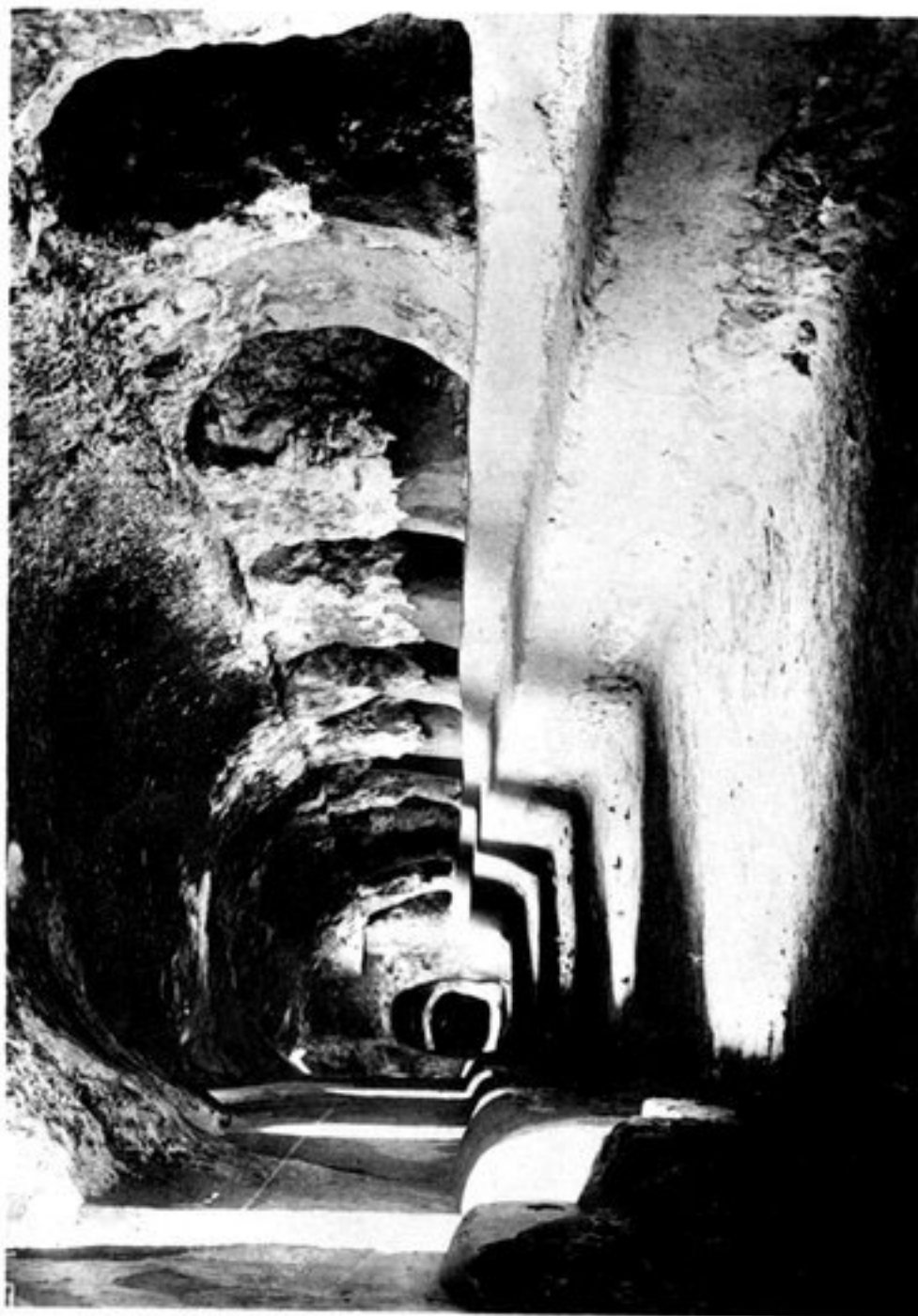
d) COULOIR SUD DE LA GROTTÉ N° 2.