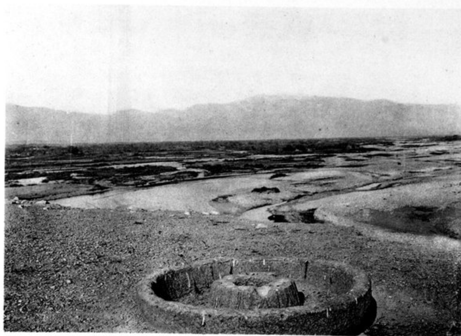
b) PARASOL DE STUPA.