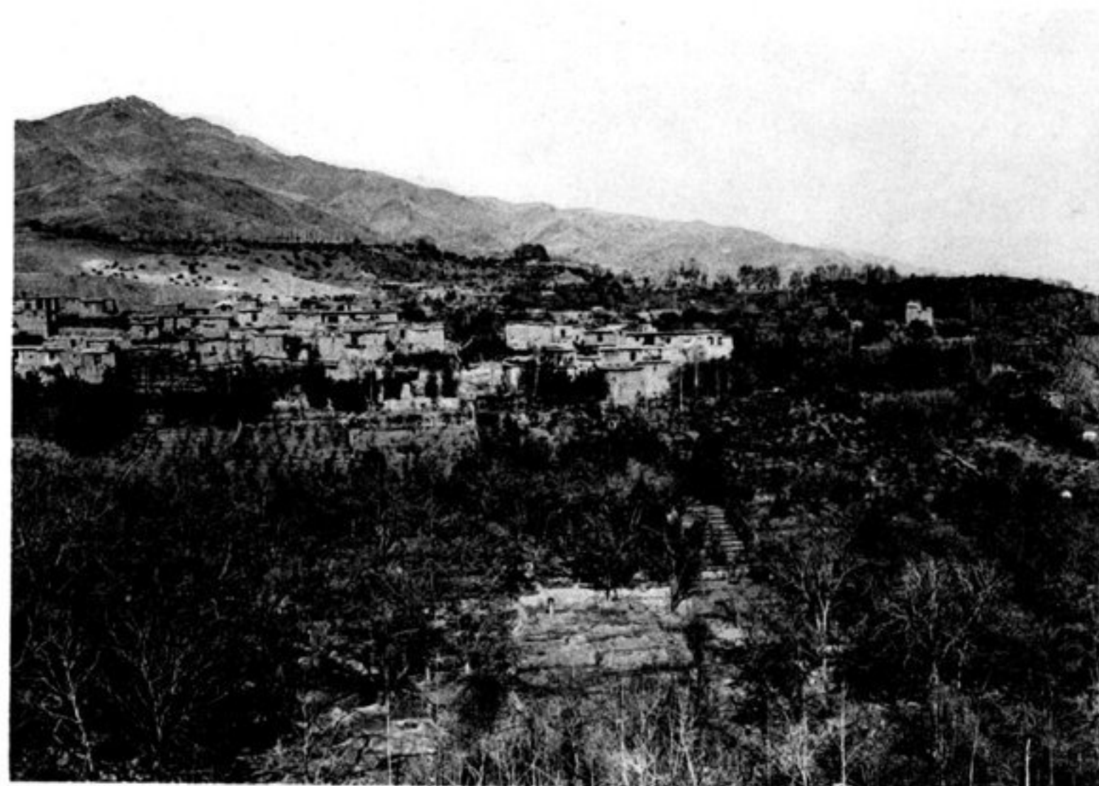
f) LE VILLAGE D'ISTALIF.