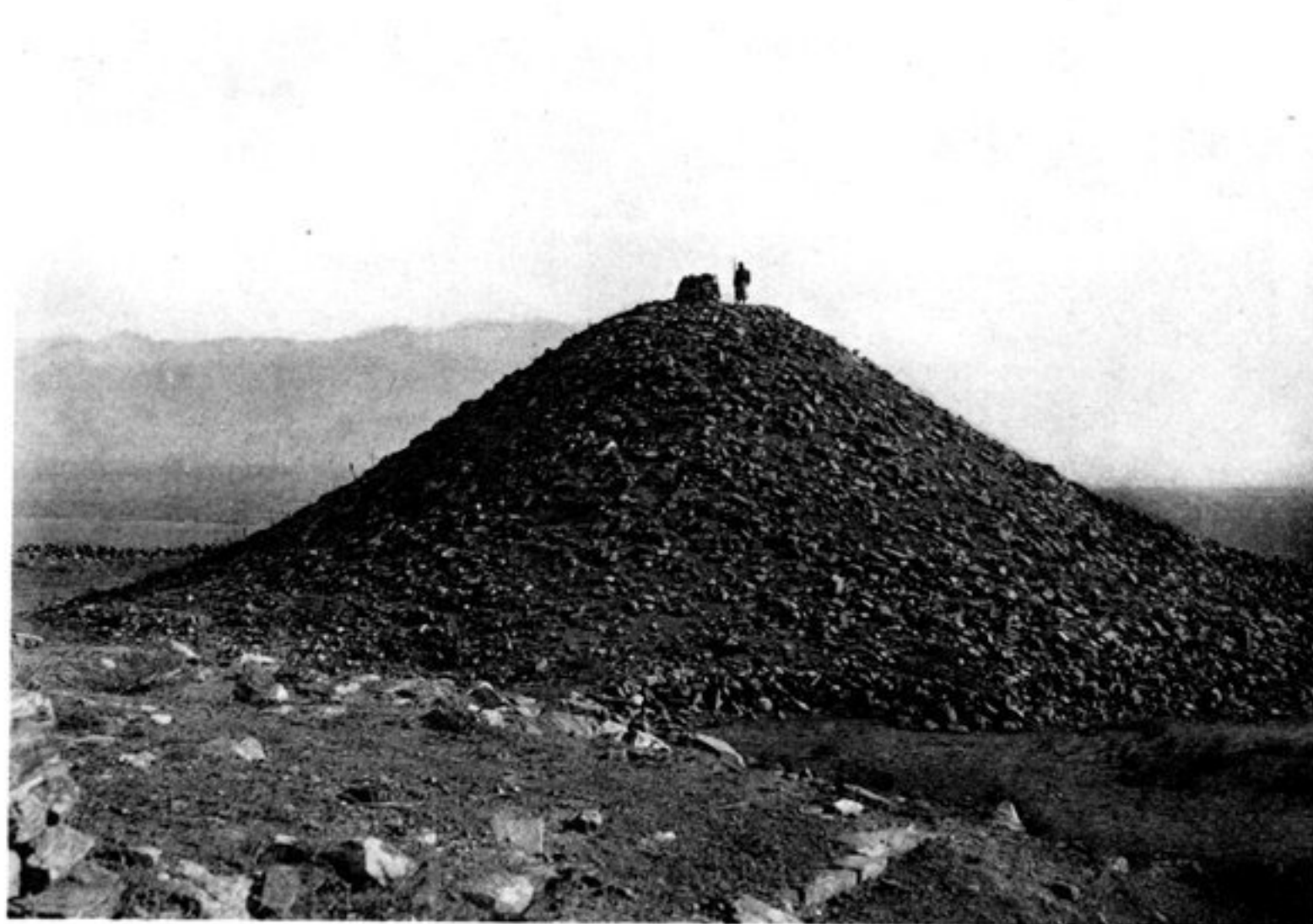
e) LE STUPA DE QALEH-SURKH.