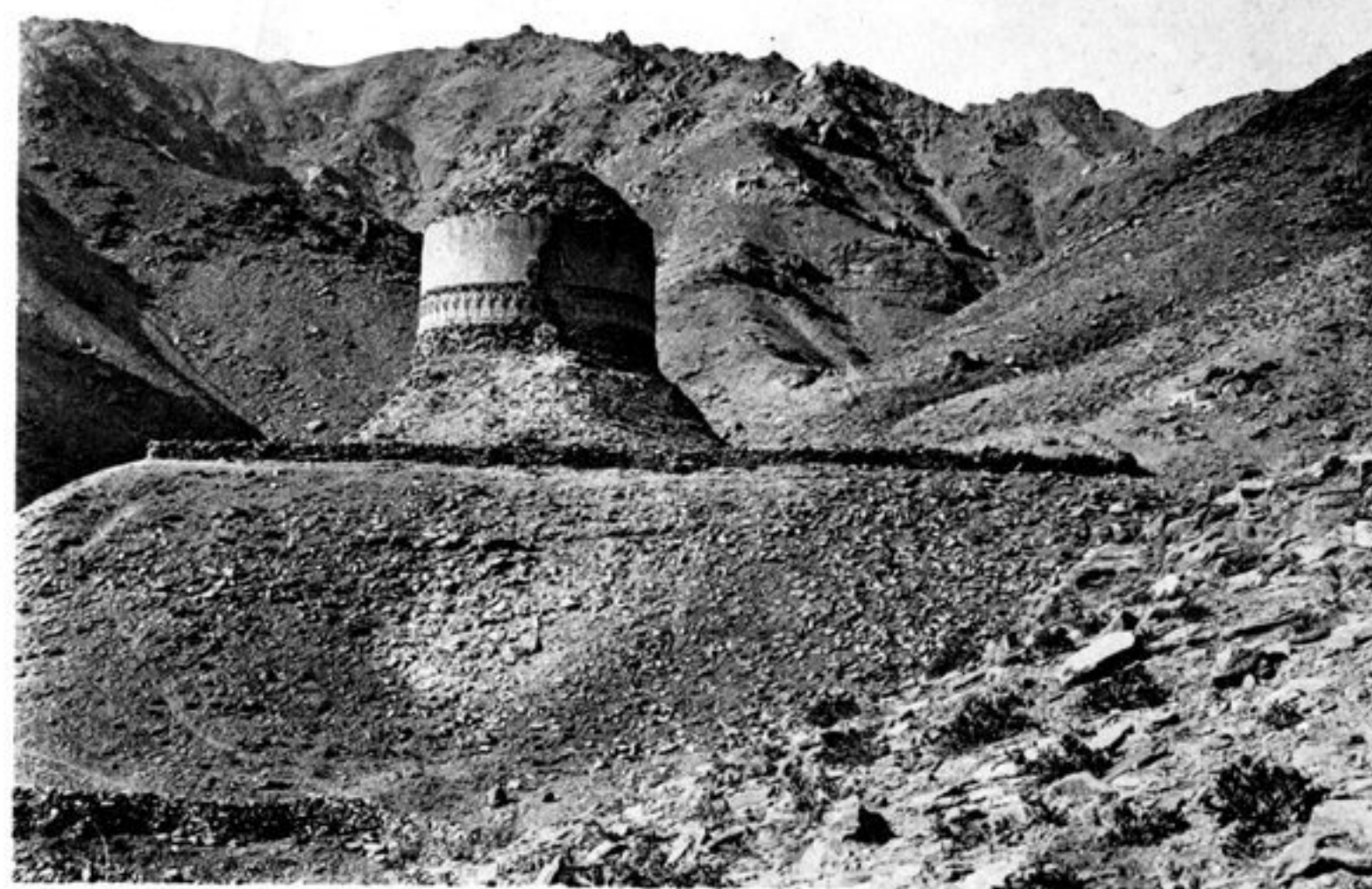
d) LE STUPA DE KANISHKA