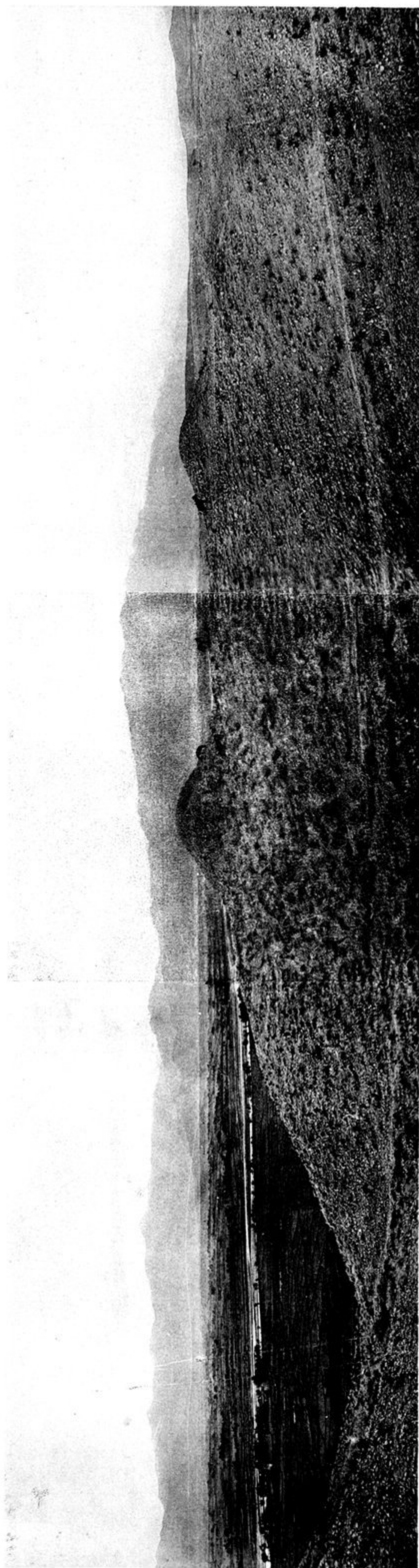
d) PANORAMA DE LA VALLÉE DE LAGHMAN.