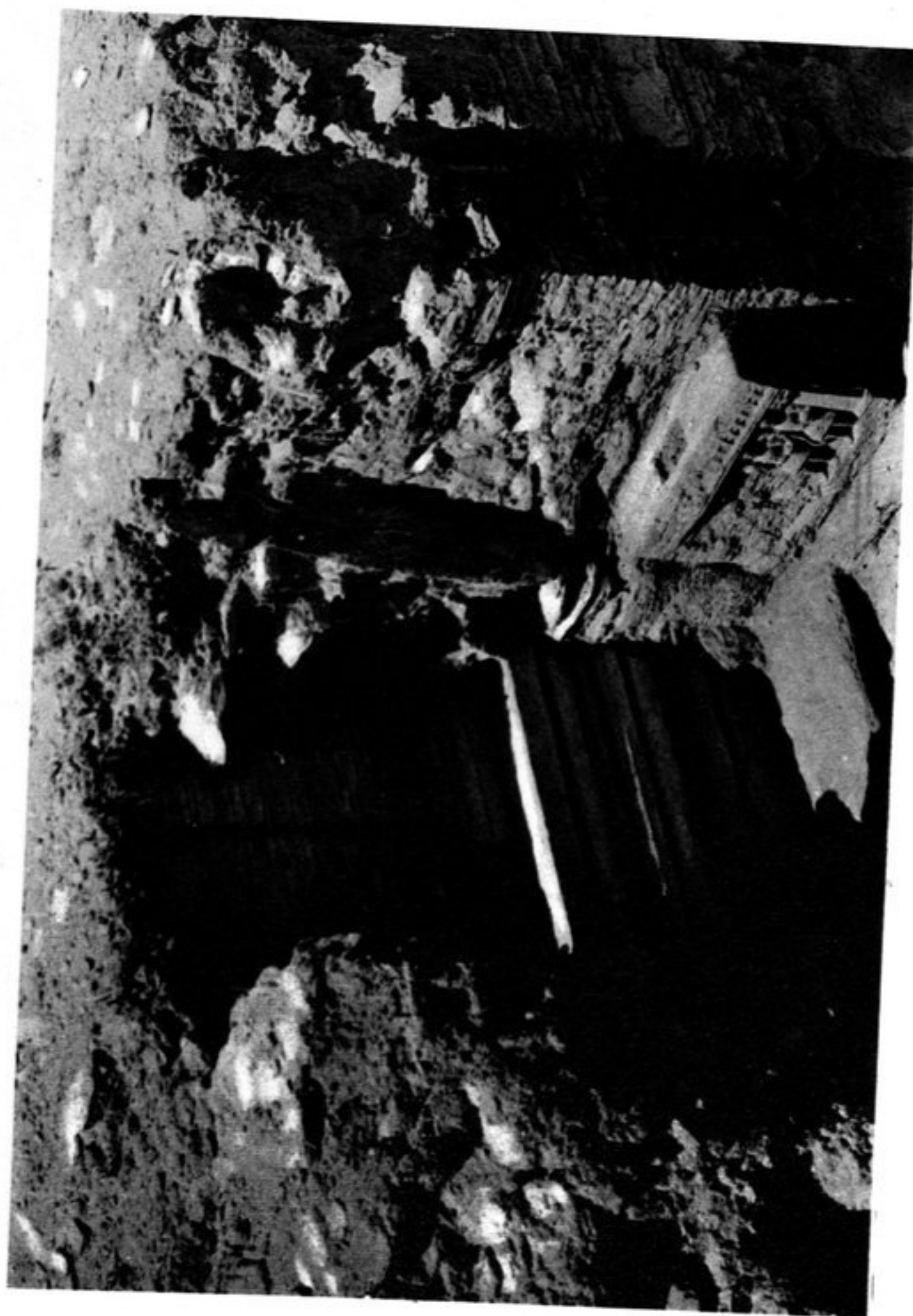
9. Stupa F 1. — Niche 9, laissant voir au fond le premier état de la construction.