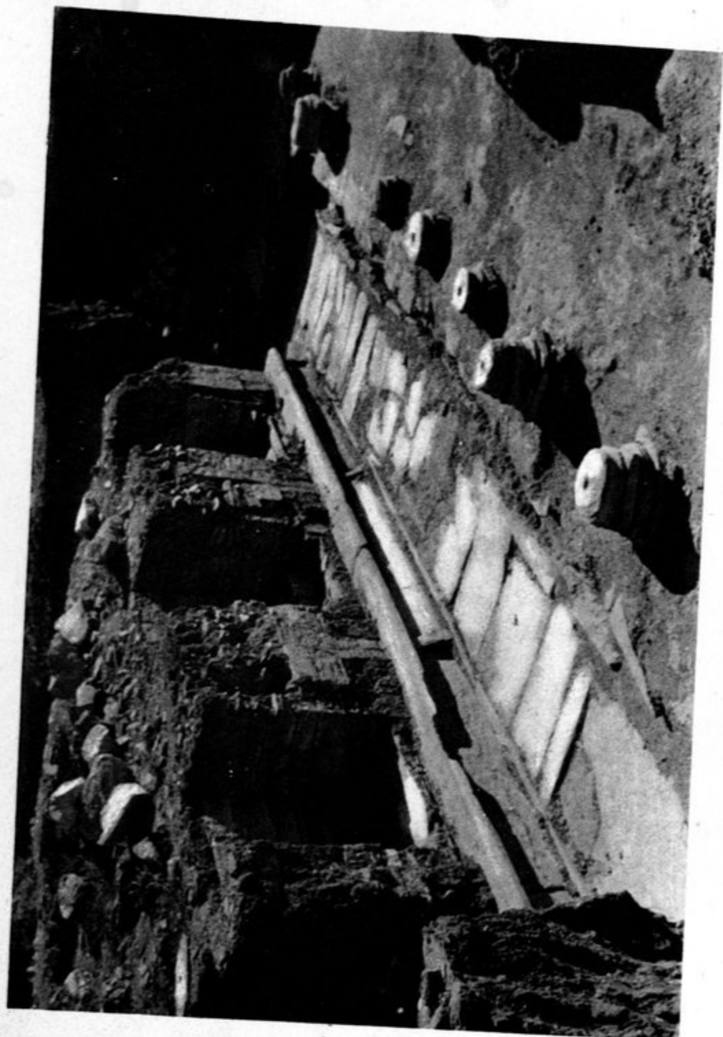
8. Face ouest du stupa F 1. — Niches 4, 5 et 6.