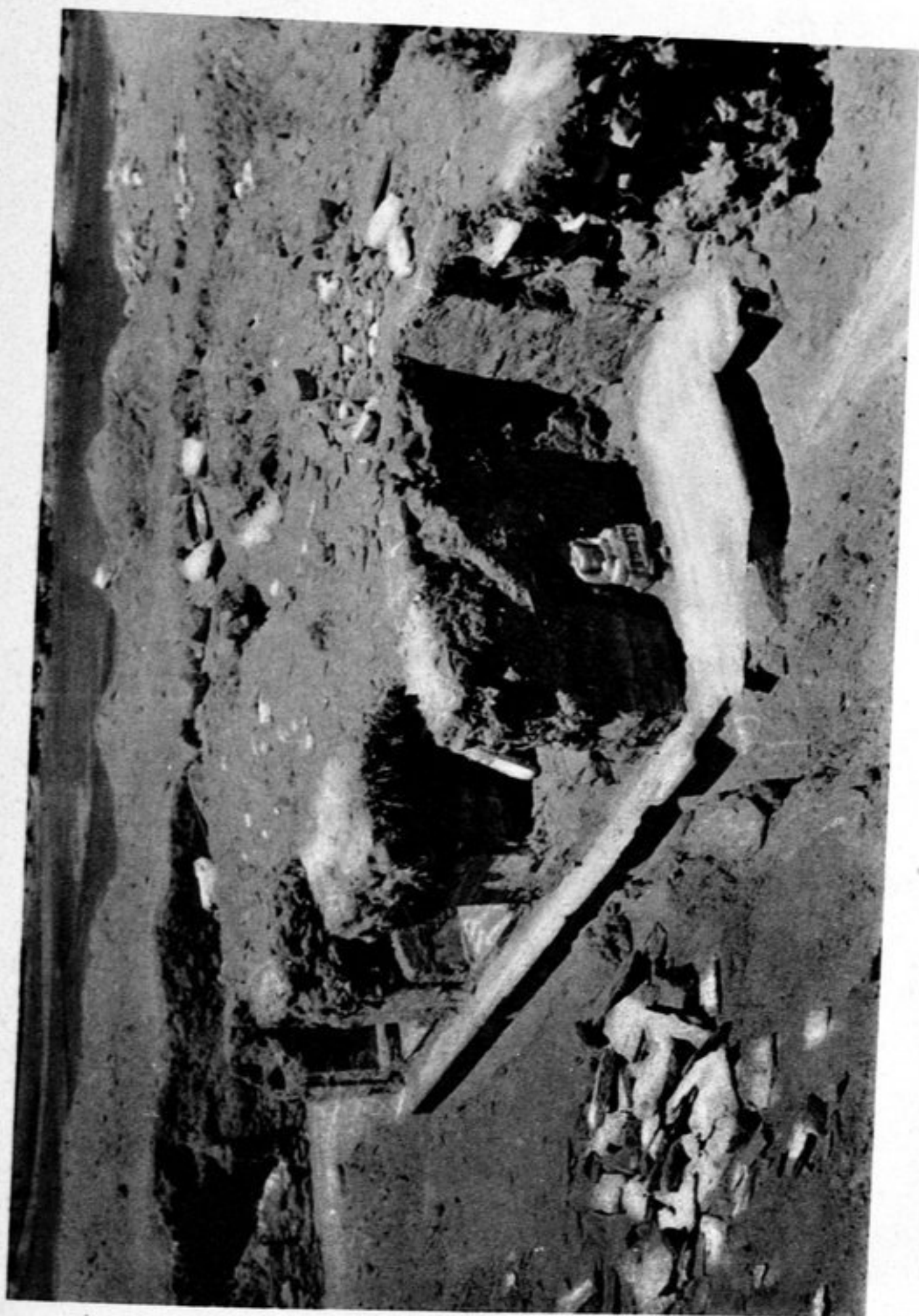
7. Stupa F 1 vu du sud-est. Buddha pénitent in situ et niches 1, 2 et 3.