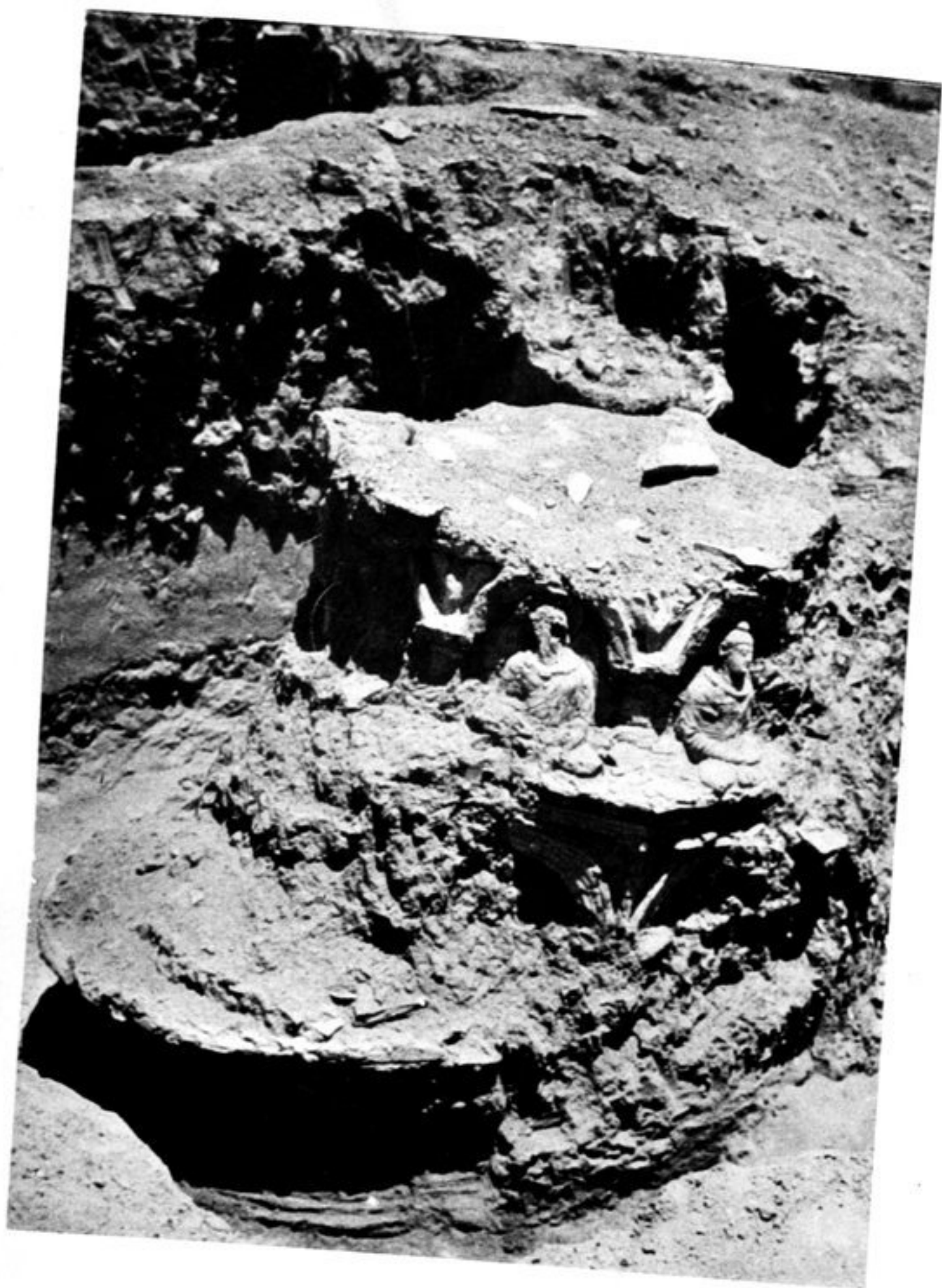
21. Stupa dans la chambre D 4, vu du sud-ouest.