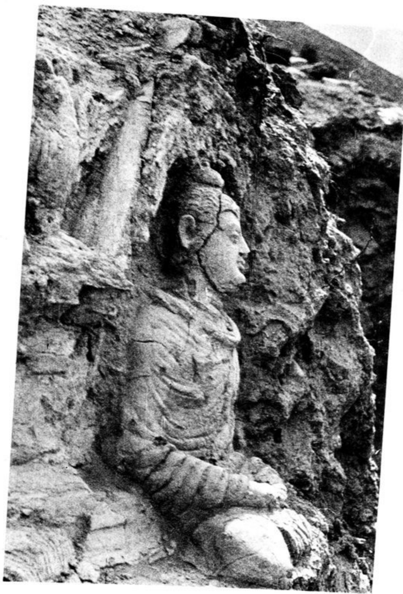
24. Buddha de la face sud du stupa D 4.