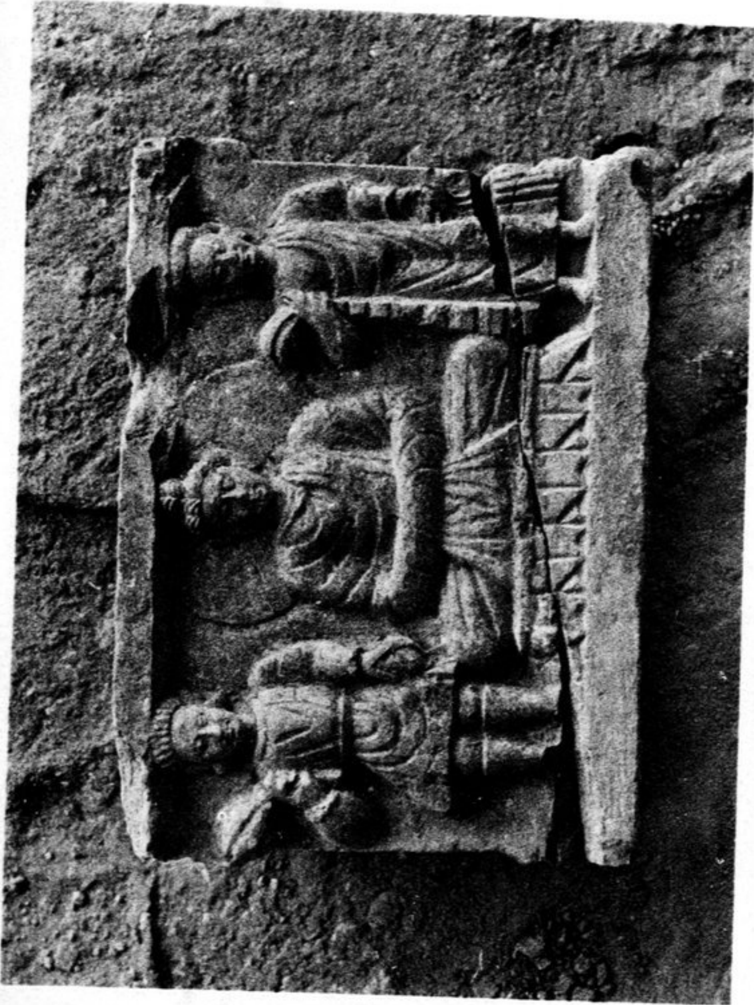
58. Schiste n° 170a. Buddha entre donateurs.