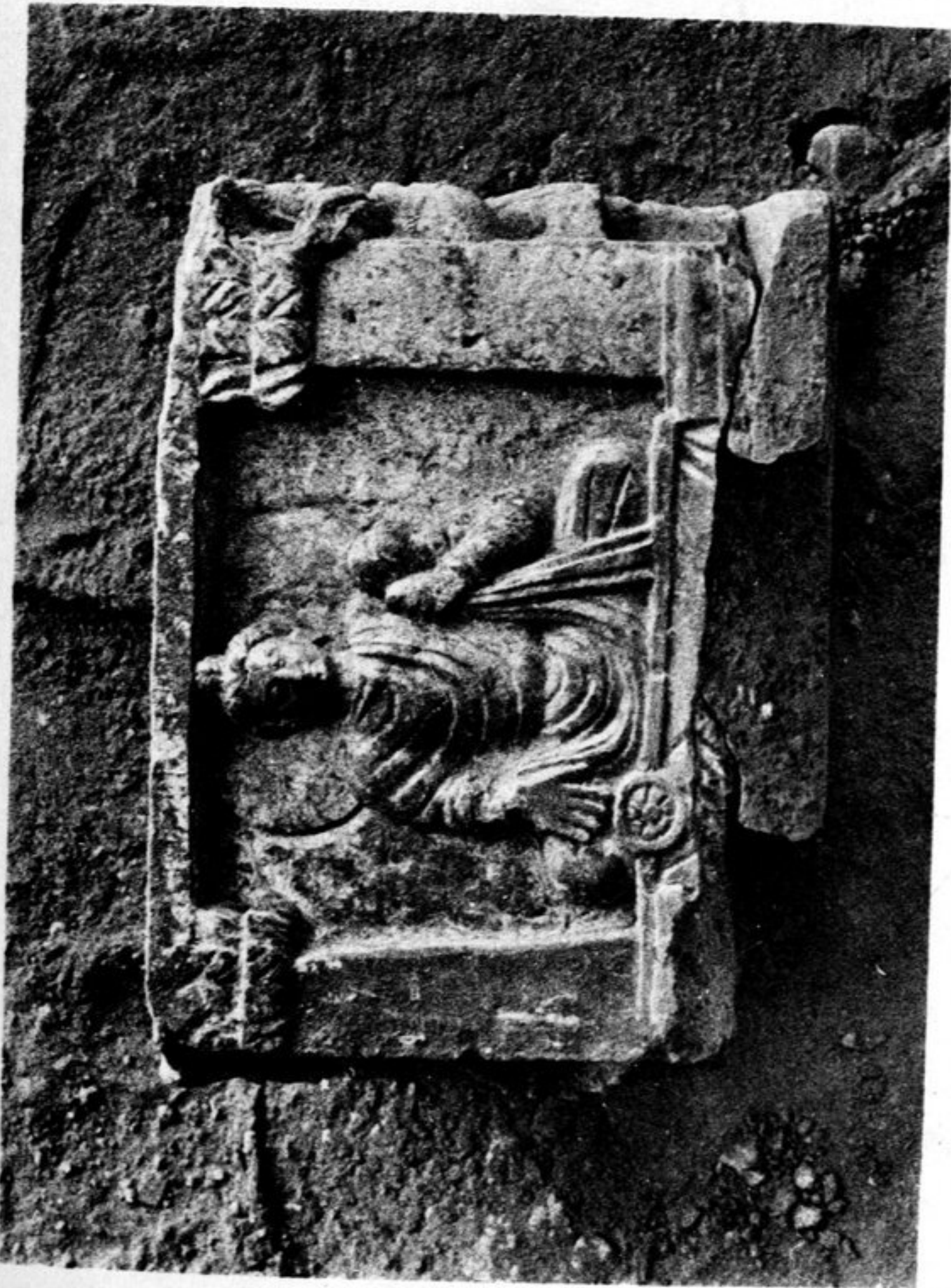
59. Schiste n° 170b. La première prédication du Buddha.