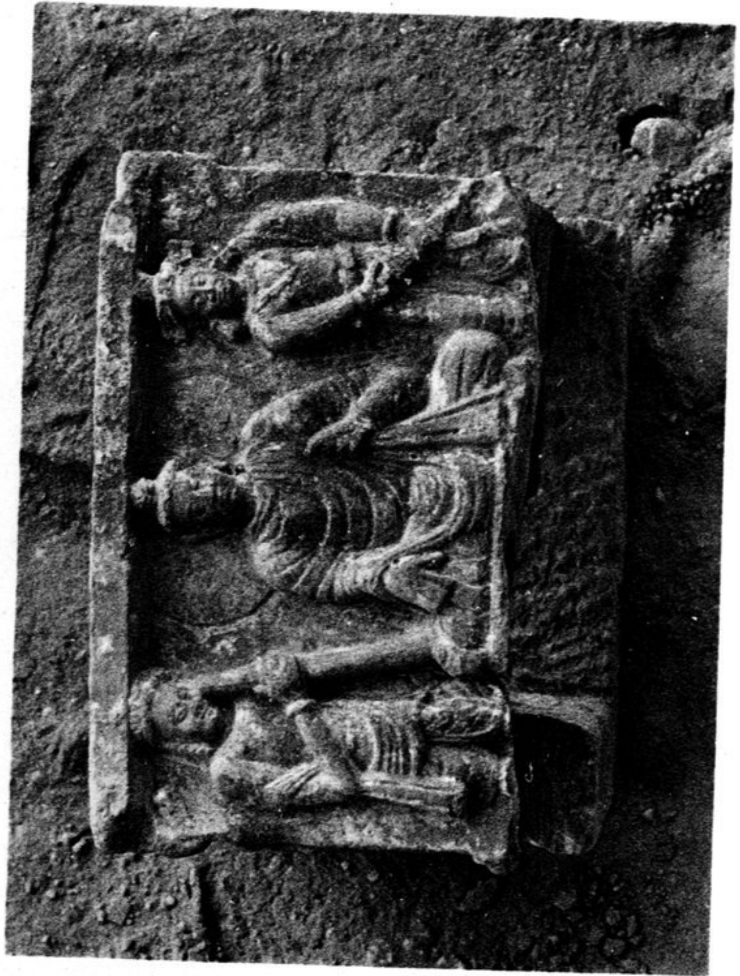
60. Schiste n° 170c. L'assaut de Mara.