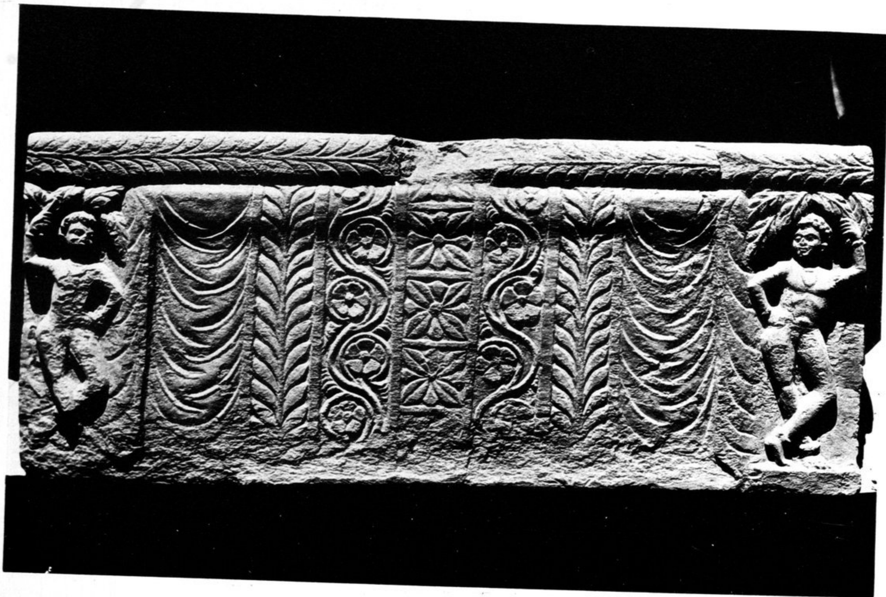
71. Schiste n° 156. Contre-marche du « Siège aux Lions ».